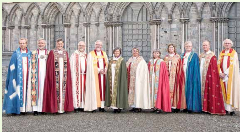
Norges biskoper samlet

Samtidig med endringene i Grunnloven ble Kirkeloven endret, slik at biskoper og proster fra nå av tilsettes av kirkelige organer. Og fra nå av har kirken selv avgjørelsesmyndighet i saker vedrørende gudstjenestelivet.