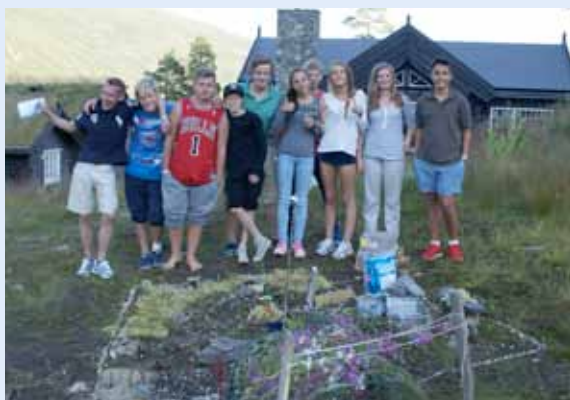
«Smurfetown», 3. plass