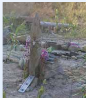
Kirken i Edelby