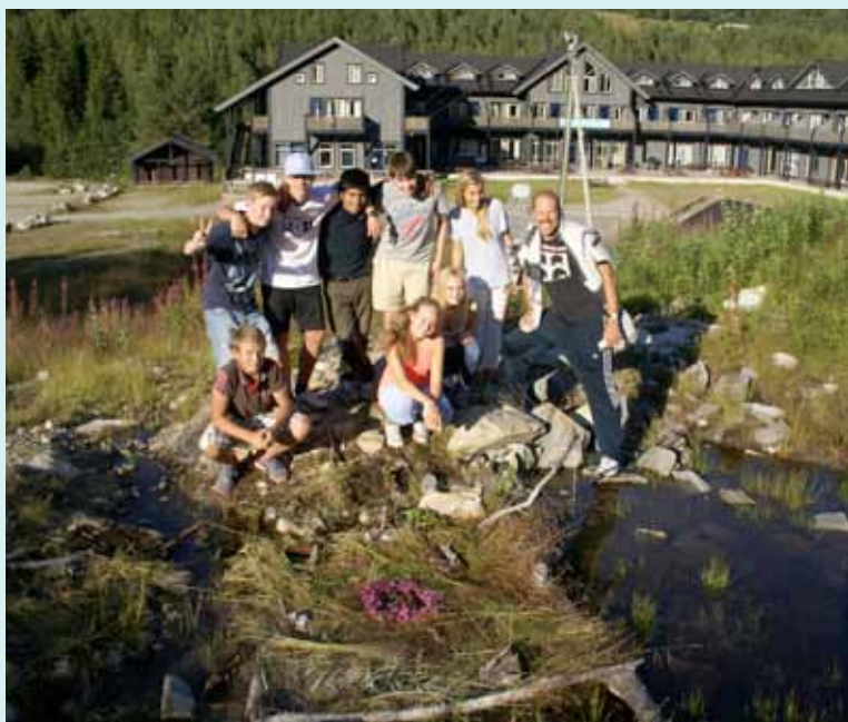
«New atlantis» 2. plass