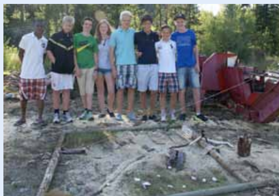
Landsbyen «Marius og noen andre nabs»