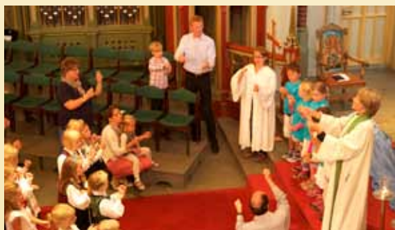
Barn i aktivitet. Familiegudstjeneste 26.8 i Bragernes kirke.