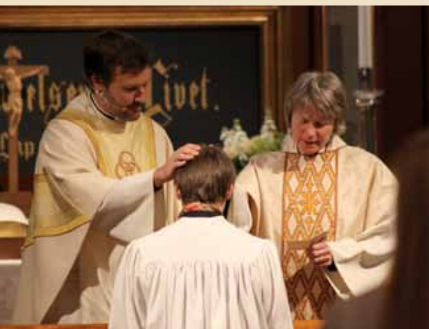
Konfirmantene ble bedt for en og en ved alterringen.