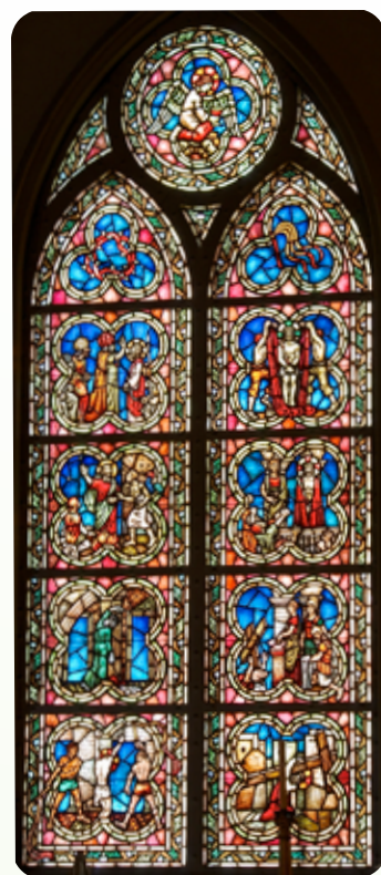
Tredje vindu (sørvest)