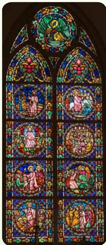
Andre vindu (sørøst)