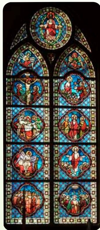
Fjerde vindu (nordvest)