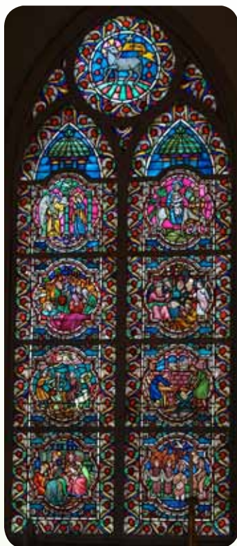
Første vindu (nordøst)

Korsfestelsen Nedtagelsen Engelen ved graven Kvinnene ved graven "Rør meg ikke!" "Emmausvandrerne Himmelfart Pinsedag