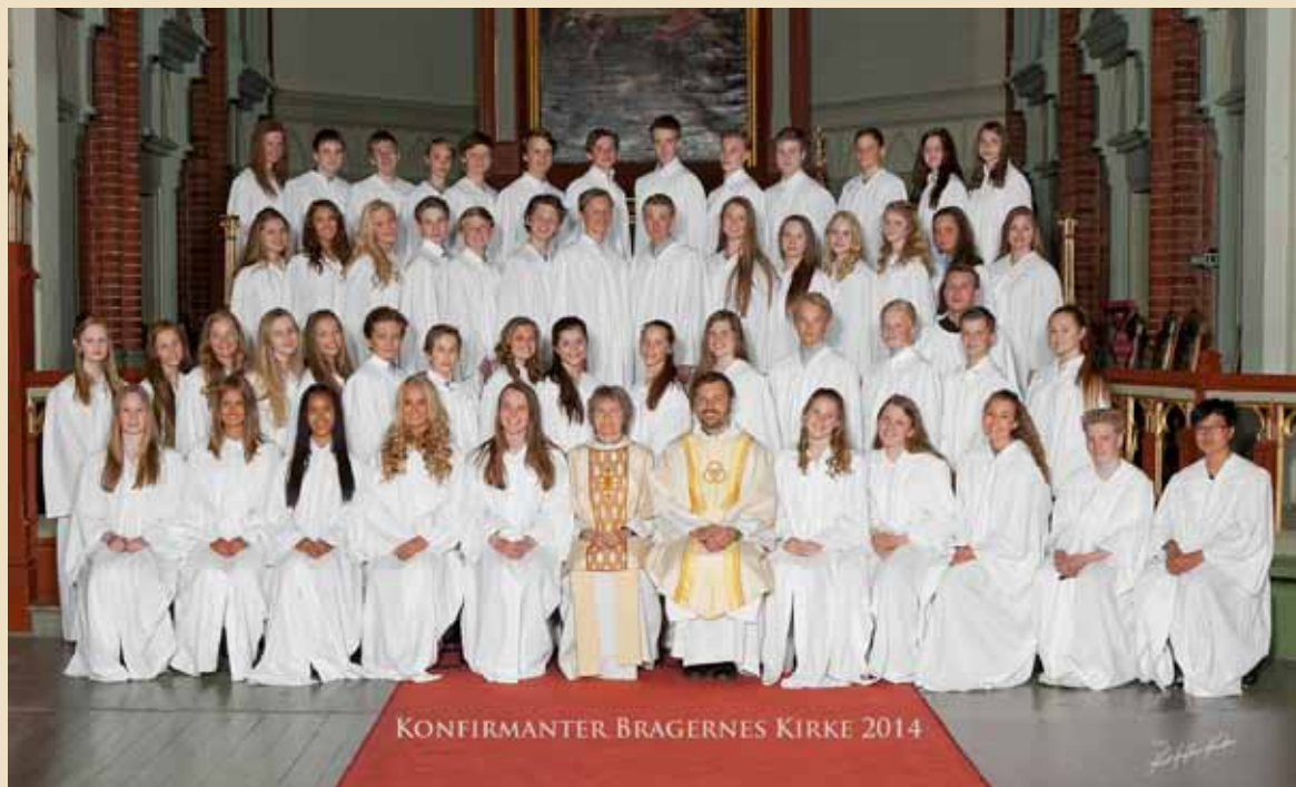
Årets konfirmanter i Bragernes kirke