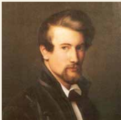
Adolph Tidemand (Selvportrett)

I år er det 200 år siden kunstneren Adolph Tidemand ble født i Mandal. Til kunstnerens 100-årsdag ble det laget en byste som står på torvet i hjembyen. I fjor ble en gangbro i byen oppkalt etter ham.