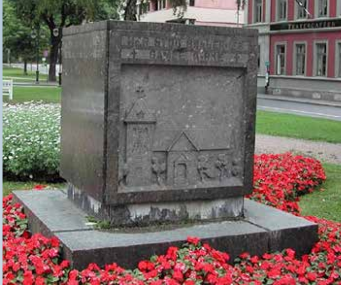
Minnestein over Bragernes gamle kirke, Nic. Schiøll

Og det kostet penger! Bare orgelet og Tidemands altertavle slukte et beløp stort nok til å lønne 20