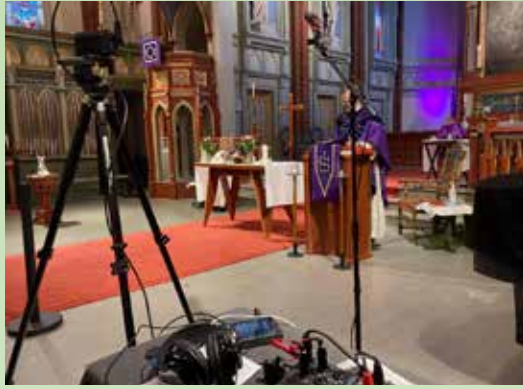
Nedstenging og strømming av messer.