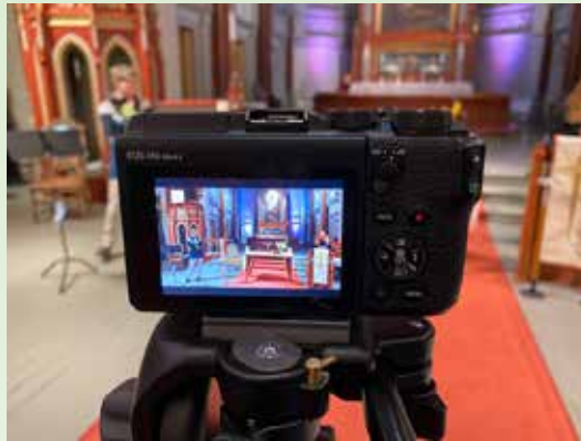
Strømming av gudstjenester på nett.