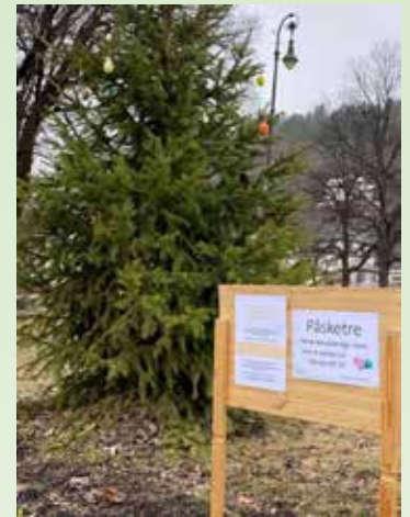
Siden kirken måtte holde dørene stengt også denne påsken, ble det laget påskeløype og satt opp påsketre utenfor kirka.