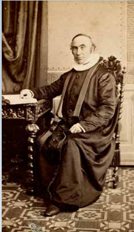
Jørgen Moe Dato: ca 1865

Under brannen kjempet mange med å redde noe av inventaret. Altertavla og kirkens hellige kar fikk de ut. Og skipsmodellen som hang under taket ble reddet. Det er den samme so henger i kirken i dag. Jørgen Moe var selv meget aktiv i redningsarbeidet. Han måtte nær-