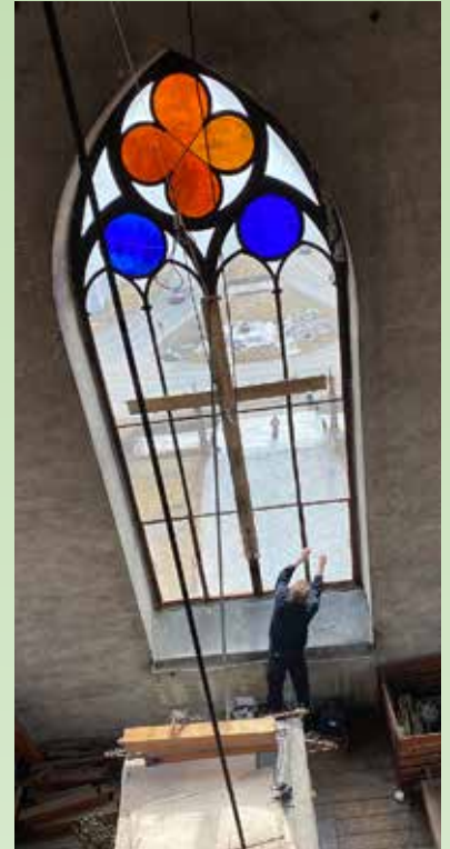
Kirketjener Morten henger opp korset i vinduet i kirketårnet.