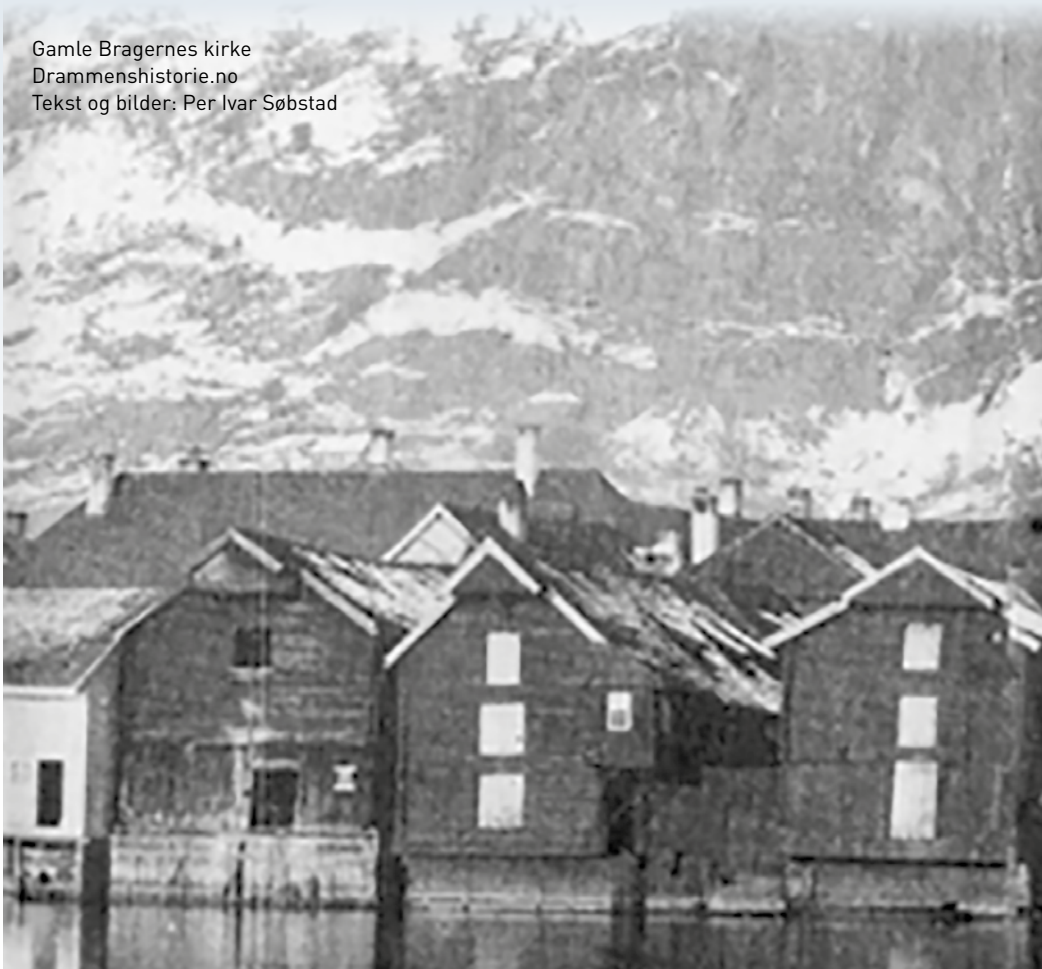
Gamle Bragernes kirke Drammehistorie.no Tekst og bilder: Per Ivar Søbstad

Og Jørgen Moe deltok aktivt i nye kirkeplaner. Kirketomta ble flyttet