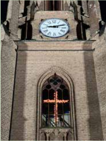
Korset i tårnvinduet lyste over byen i hele påsketiden.