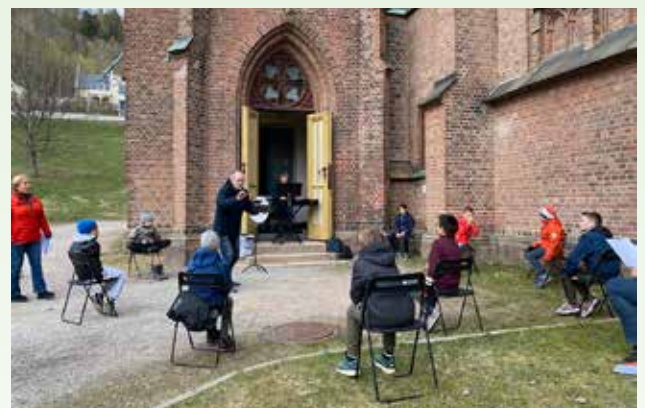
Guttekorøvelse utenfor kirka pga koronarestriksjoner.