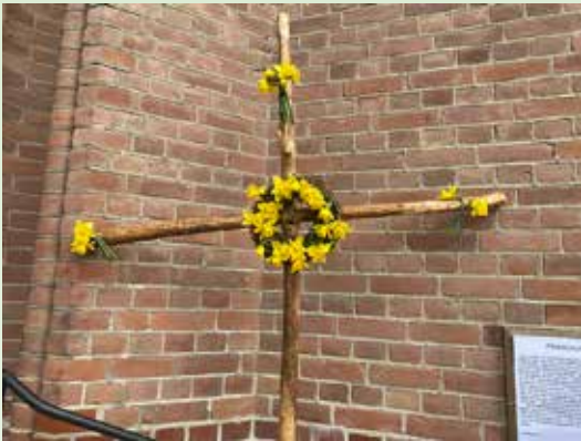
Påsketablå utenfor kirken påskedag.