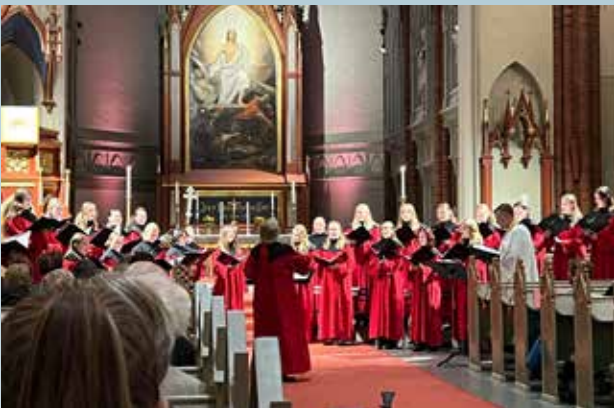
Evensong med Bragernes kirkes ungdomskor. Urfremføring av musikk av Terje Kvam og Jørn Fevang.