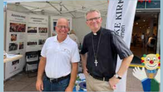
Kirken var tilstede med stand på Elvefestivalen.