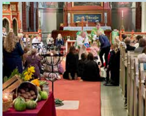
Høsttakkefest med myldring i midtgangen.