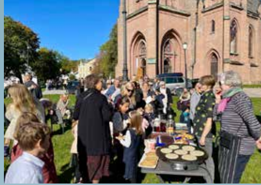
Høst i hagen med kirkekaffe i Kirkeparken.