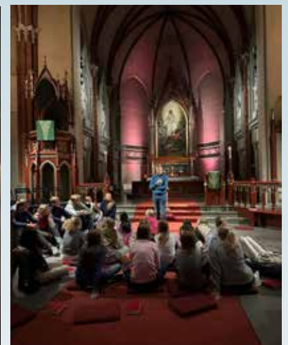
Fortellerkveld med konfirmantene.