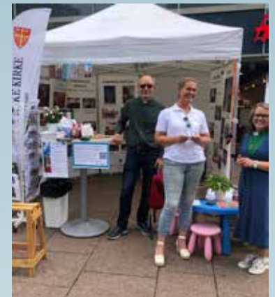
Kirkens stand på Elvefestivalen.