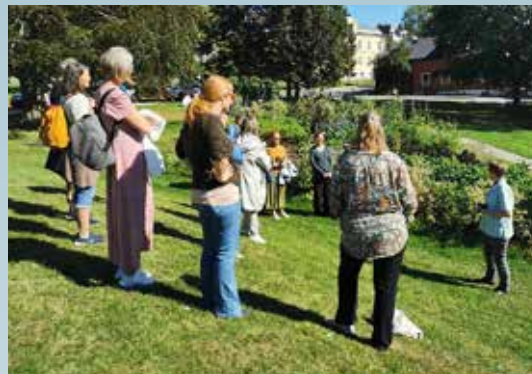
Besøk i Kirkeparken av diakoner fra Borg bispedømme.