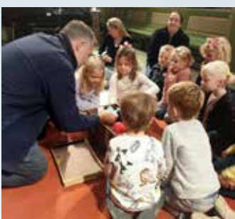
Samling med 4- og 6-åringer.