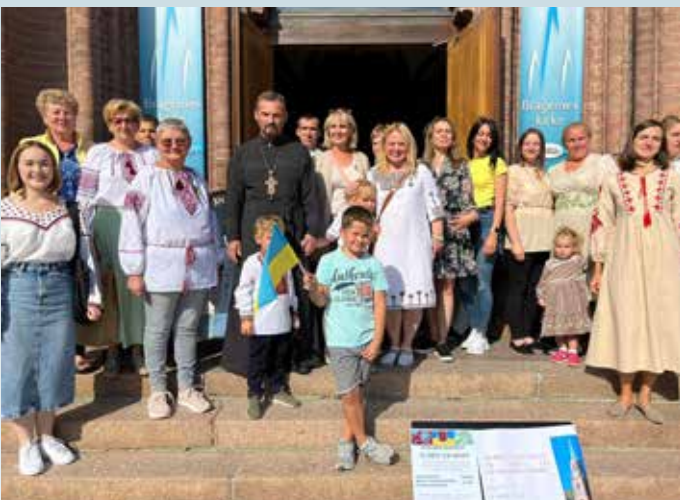
Ukrainsk messe i Bragernes kirke.