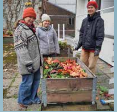
Albumhagen klargjort for vinteren.