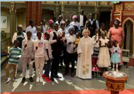
Anglikansk-sudanesisk dåp i Bragernes kirke.