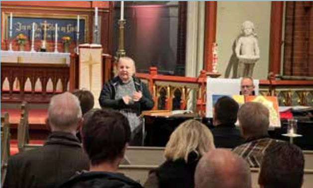
Foredrag om Bragernes menighets konfirmantopplegg.