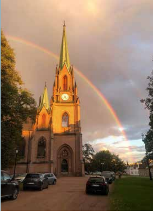
Regnbue over Bragernes Kirke.