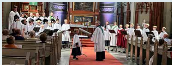
Evensong med opptak av nye korgutter.