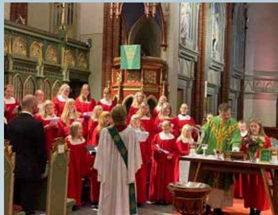
Familiemesse med jentekoret.