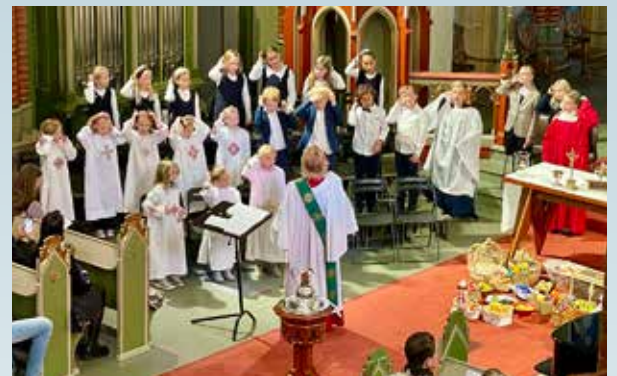
Høsttakkefest med aspirantene og Minores.