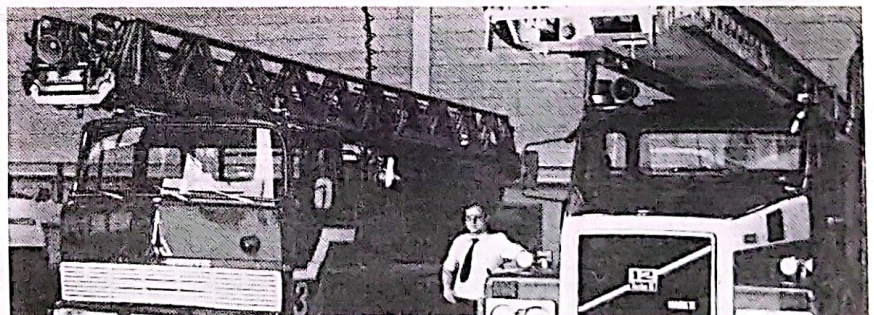
Brannvesenets stiger når ca. 30 meter over bakken og kan dermed nå til 9. etasje. Dessuten er det en forutsetning for å bruke stige bilen at den kommer frem til bygningen som brenner. Hvis en blir hindret i dette av parkerte biler o.l., er selv en 30 meter lang stige til liten nytte.