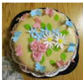
Kake med symbolikk.