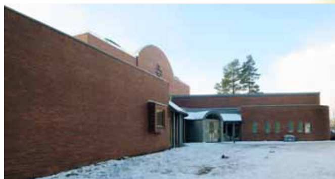
En vinterdag utenfor Konnerud kirke.