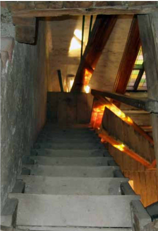
Trappen i tårnet.

På langfredag, derimot, er det veldig mange lokale skikker. Svært mange bruker bare den lille klokka når de ringer inn til gudstjeneste, og da som regel som klemt (ett og ett slag med kort pause i mellom). Etter gudstjenesten er det enkelte kirker som ikke ringer med klokkene i det hele tatt, menigheten for-