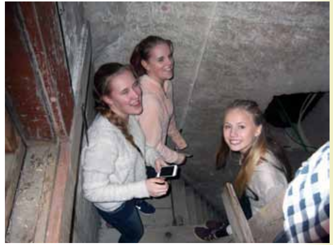
På vei oppover.

later kirken i stillhet og ettertanke, mens man andre steder klemter som etter en begravelse.