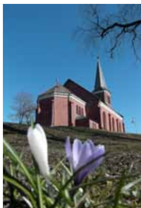
Skoger kirke en vårdag.