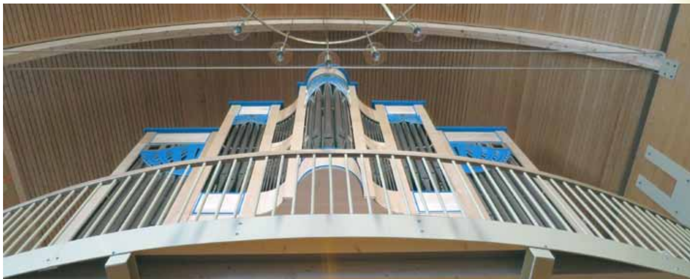
Det nye orgelet på mesaninen (galleriet) i Konnerud kirke.

Konnerud kirke har fått nytt orgel. Det er et vakkert og velklingende instrument, som kommer til å glede mange, selv lenge etter at vi som leser disse linjene ikke lever lenger.