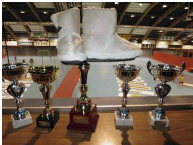
Årets pokaler. Nytt av året er vandrepokalen i tøffelklassen i volleyball.

Midt på natta var det kamppause med Globalt marked - solidaritetsmarked til inntekt til Fasteaksjonen. Det var salg av popcorn, Valentinshjerter, sauer, plaggånder m.m., og hele summen på rundt kr. 7000,- gikk til Fasteaksjonen.