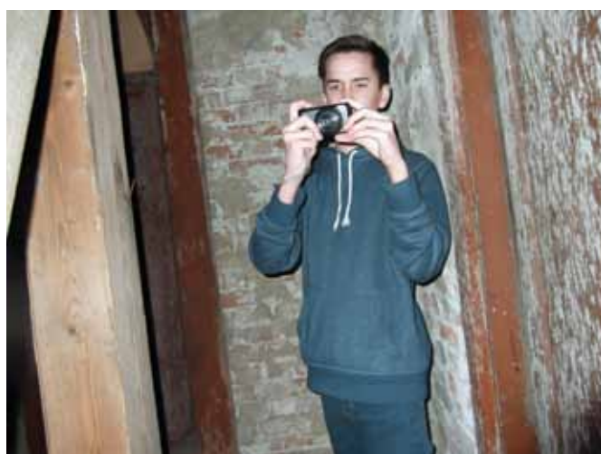
Konfirmanter var en tur i tårnet, utstyrt med kamera.