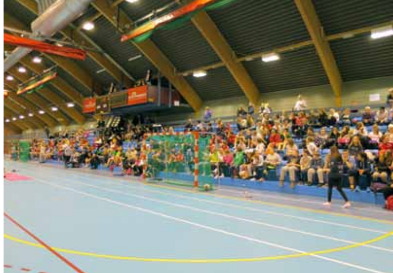
Morgenstund... kl. 07.49 søndag morgen.

seg som beste supporter. Takket være hans innsats fikk vi også pokal for beste supporterlag.