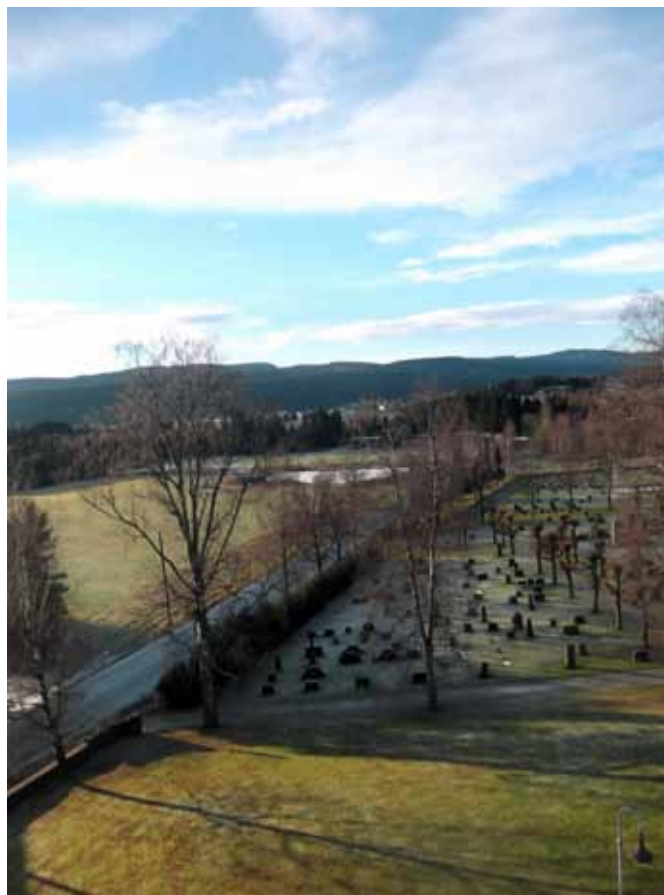
Utsikt fra kirketårnet i Skoger kirke 13. desember 2014.

Nå nærmer vi oss påske med raske skritt – og selv om vi på Konnerud og i Skoger gjerne tar proklamasjonen "Våren er kommet!" med en klype salt, (vi har jo opplevd at det har snødd på konfirmasjonsgudstjenester i mai); så er det liten tvil: Våren er på vei! Vi hadde fastelavensgudstjenester allerede 18. februar, første mars er for lengst overstått, de første snøklok-