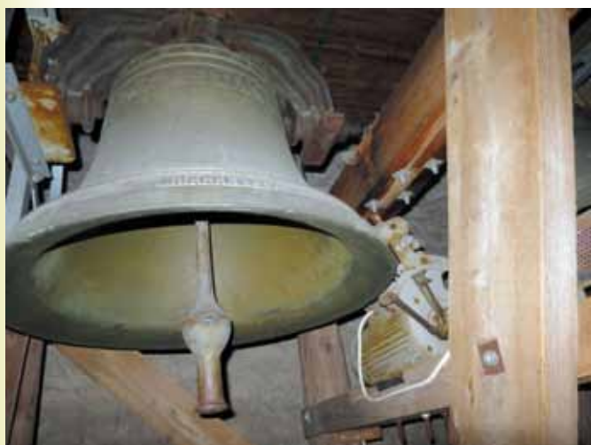
Kirkeklokke i Skoger.

På palmesøndag ringes det som vanlig til søndagsgudstjeneste. I motsetning til hva mange tror regnes ikke palmesøndag som starten på påsken, men som