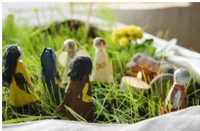
Påskedag. Amicus barnehage laget påskelandskap.

bolske handlinger - blant annet brukte vi ikke orgelakkompagnement, men gitar eller fløyte. Et tomt kors (- som ble båret inn under postludiet på kveldsgudstjenesten på skjærtorsdag) - var satt opp med brostein og en hvit julestjerne ved foten. På begynnelsen av gudstjenesten kom folk fram og tente telys som ble plassert på steinene. Etter hvert som lesningen av Jesu lidelseshistorie nærmet seg slutten ble lysene blåst ut, ett etter ett. Under siste verset på salmen etter siste tekstlesing ble blomsten båret bort og det siste lyset blåst ut. Det var satt av tid til at man kunne sitte i stille ettertanke for så å gå rolig ut etter hvert. Men et år skjedde det noe uventet. Da lyset var blåst ut og blomsten fjernet reiste en kvinne seg plutselig og brøt stillheten idet hun forlangte lighter eller fyrstikker. Så gikk hun fram og tente flere av lysa ved korset idet hun nærmest ropte ut at « det er jo ikke sånn det slutter! Dere må jo fortelle at dette ikke er slutten! » - og det er jo ikke det. Vi vet at det fortsetter med seier og triumf tre dager senere. Og kanskje er det godt å bli minnet på - og minne hverandre på dette litt oftere. Det er så altfor mange av oss som henger fast i depressive tanker og følelser. Vi lever på en måte i et «langfredagsmodus», ikke bare i vårt trosliv, men også i våre «hverdagsliv».