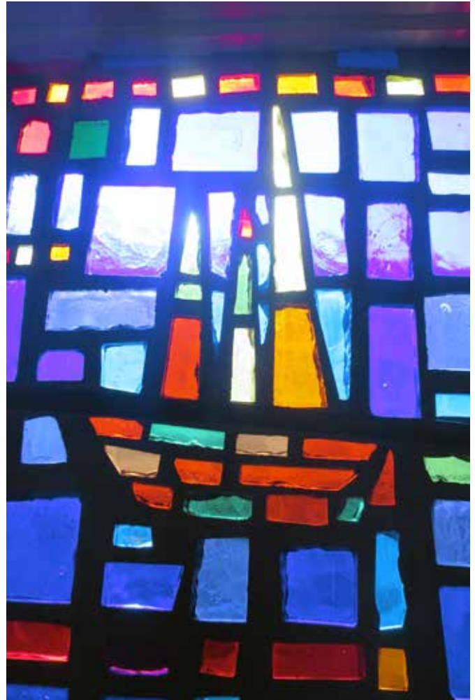
Kirkeskipet i Sjømannskirken i Hamburg.

Men så skjer altså det helt usannsynlige, det som totalt bryter med alle kjente naturlover: Jesus står opp igjen fra de døde. Han viser seg først for kvinnene som kommer til graven for å stille liket etter jødisk skikk, så oppsøker han sine disipler og så til sist flere hundre av dem på en gang. I førti dager var han sammen med dem. Så gir ham dem altså befalingen om å gå ut i hele verden, men ikke noen «bruksanvisning» på hvordan de skulle gjøre det. De fleste av Jesus' tilhengere var enkle fiskere og arbeidsfolk som stort sett bare snakket arameisk, mens romerne, okkupasjonsmaktene, snakket la-