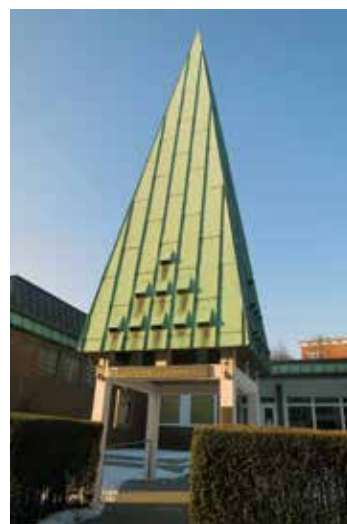
Sjømannskirken i Hamburg.

Sjømannskirken i Hamburg har lang historie, som startet i 1907. Sjømannskirken ble et sted norske sjøfolk kunne komme til, når de kom i havn. Men blokaden under første verdenskrig, gjorde at det ikke kom norske skip til Hamburg. Kirken måtte ta en pause fra 1914-20. I 1920 kjøpte kirken en bygård, og kirken var igjen et sted for nordmenn i utlandet. I 1936 kunne kirken endelig innvie sin egen kirke. Men gleden ble kortvarig. Sjømannskirken ble bombet, og lagt i