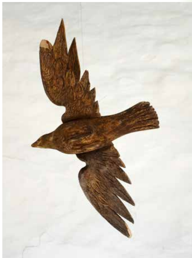
Duen er et symbolen for Den Hellige Ånd - denne henger over døpefonten i Skoger gamle kirke.

«Er de ikke galileere alle disse som taler? Hvordan henger det sammen at hver og en av oss hører dem tale på vårt eget morsmål? Vi er partere og medeere og elamitter, folk fra Mesopotamia, Judea og Kapadokia, fra Pontos og Asia, Frygia og Pamfylia, fra Egypt og Libyaområdet mot Kyréne, vi er jøder som har gått over til jødedommen og har flyttet hit fra Roma, kretere og arabere - og vi hører dem tale om Guds storverk på vårt eget språk». De visste ikke hva de skulle tro, og forvirret spurte de hverandre: «Hva er dette for noe?» Vi er kanskje ikke mindre forvirret i vår såkalte moderne tid, med simultanoversettelser og interog- intranett og det hele. Forunderlig var det, og like forunderlig er det. Men dette var altså starten. Mange av dem som hørte disiplenes forkynnelser ble troende. De troende søkte sammen- fortsatt levde det jo mange hundre som hadde møtt Jesus etter oppstandelsen. De fortalte hverandre hva som hadde skjedd, og disse igjen fortalte sine opplevelser videre. Så fra denne dagen starter den