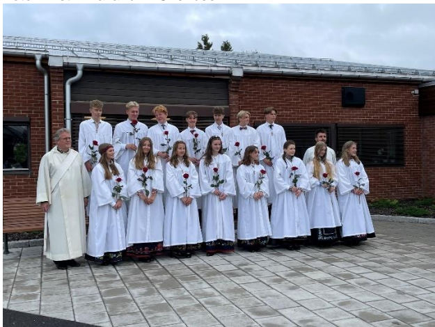
Søndag 4. September