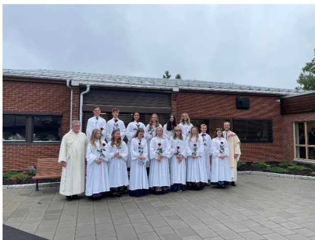
Lørdag 10. september