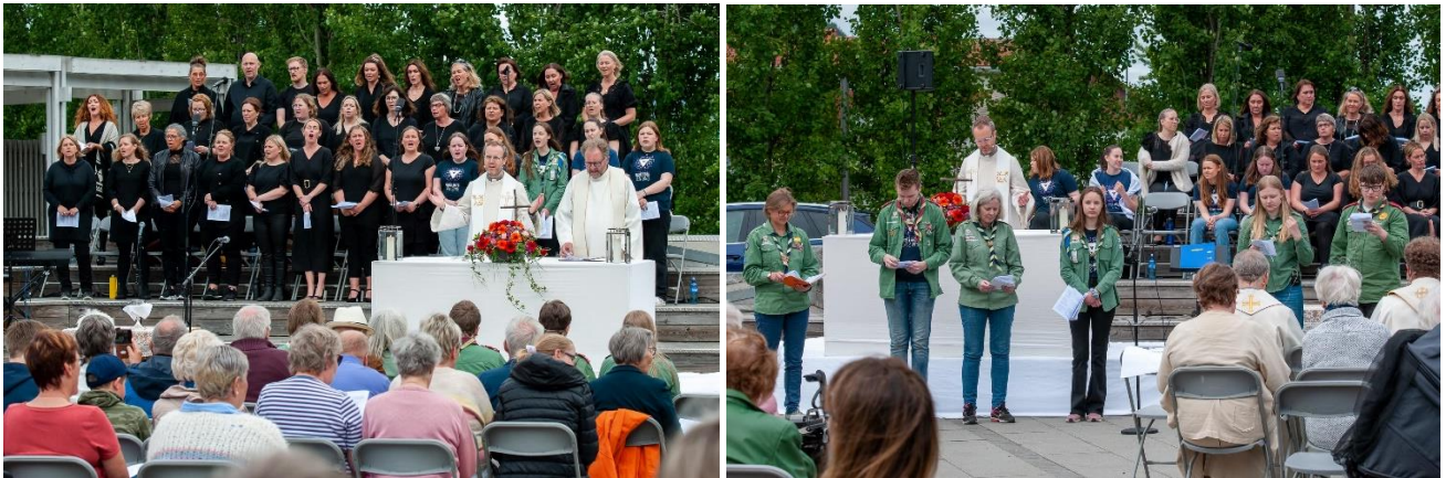
Torgmesse 12. juni.

Vi feiret torgmesse 12. juni. Predikant var prost Magelssen. Det var godt oppmøte, også i år. Nedre Eiker Gospelkor medvirket for første gang, og sang med smittende sangglede, sammen med NETS. Offeret gikk til Mjøndalen 1 KFUK-KFUM-speiderne, som fylte 100 år dette året (gratulerer!). Det legges ned mange dugnads- og arbeidstimer for å få til denne gudstjenesten, og dagen generer mange smil i menigheten.