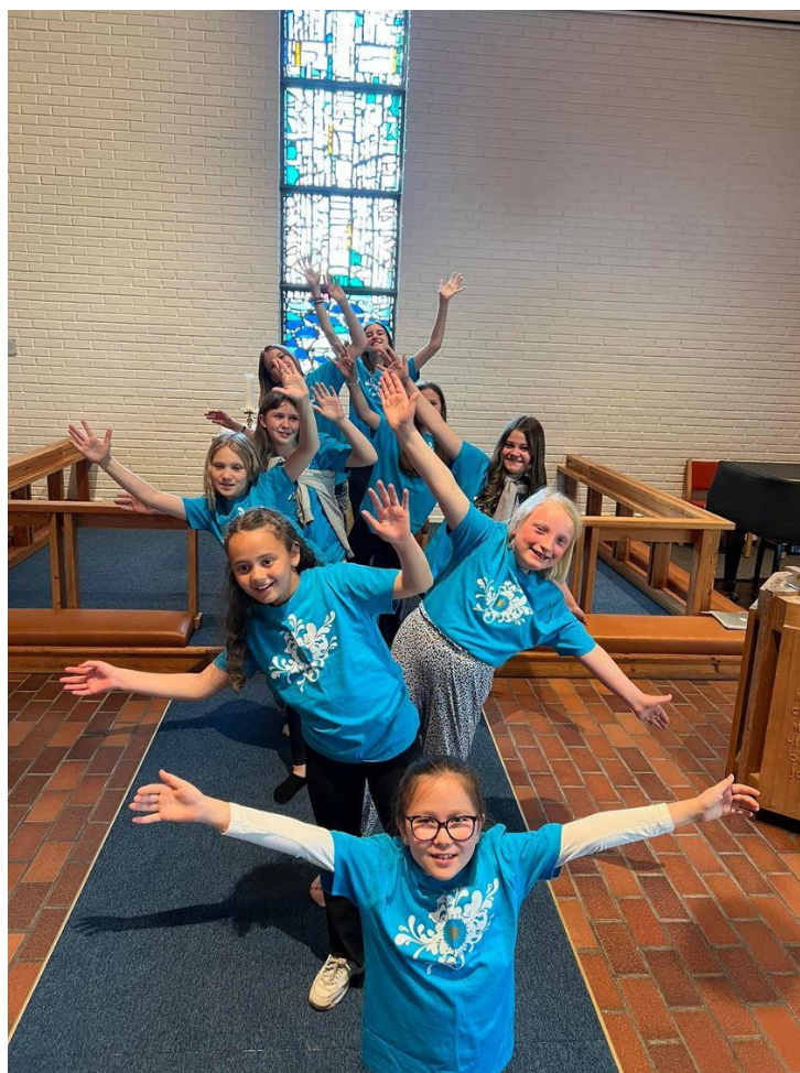
Nedre Eiker Soul Children.

Høsten 2022 har Nedre Eiker Soul Children sunget på en gudstjeneste i november og julekonsert i desember i Nedre Eiker kirke.