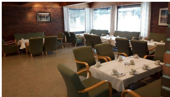
Minnesamvær i ungdomssalen og peisestua.