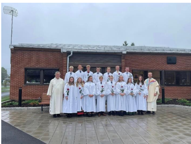
Lørdag 10. September