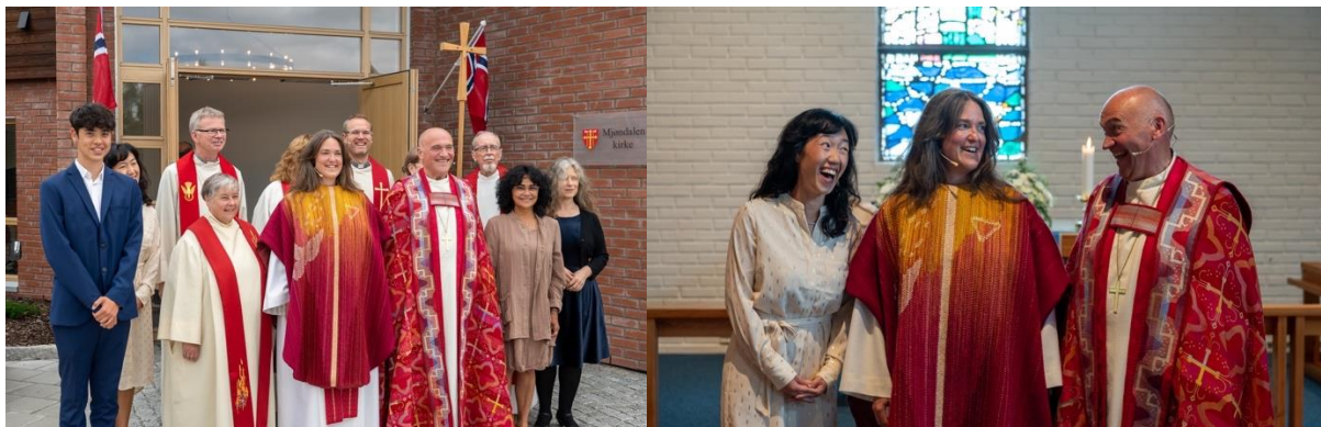
Ordinasjon i Mjøndalen kirke 28. August.