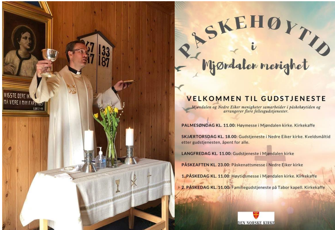
Tabor 2. Påskedag.

2. påskedag var det endelig igjen gudstjeneste på Tabor kapell. Det var et stappfullt kapell med en begeistret og forventningsfull menighet. Det var mange som syntes det var godt å være tilbake igjen i kapellet, og en flott gudstjeneste ble avsluttet med deilig kirkekaffe. Totalt ble det fem gudstjenester på Tabor dette året, alle godt besøkt.