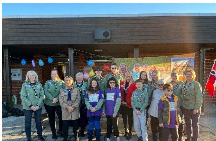
Mjøndalen 1 speidergruppe 100 år.

Arnstein representerte menigheten og holdt en tale på speiderforeningens 100-årsfest 12. november.