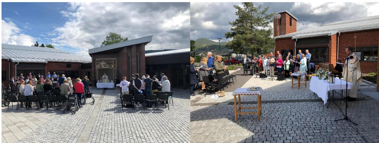
Friluftsgudstjeneste 22. mai.