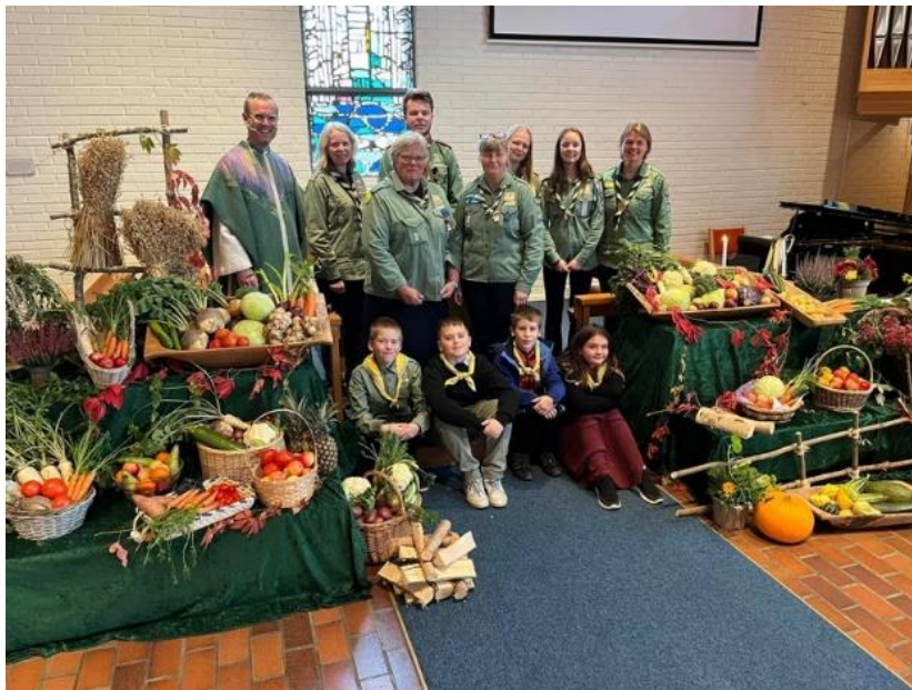
Høsttakkefest familiemesse 16. oktober.

Høsttakkefest familiemesse ble avholdt i oktober sammen med utdeling av boken Helt førsteklases. Speiderne deltok i gudstjenesten og pyntet med masse fra høstens grøde. Kirkekaffe med lapskaus etter gudstjenesten. Et flott og godt samarbeid!