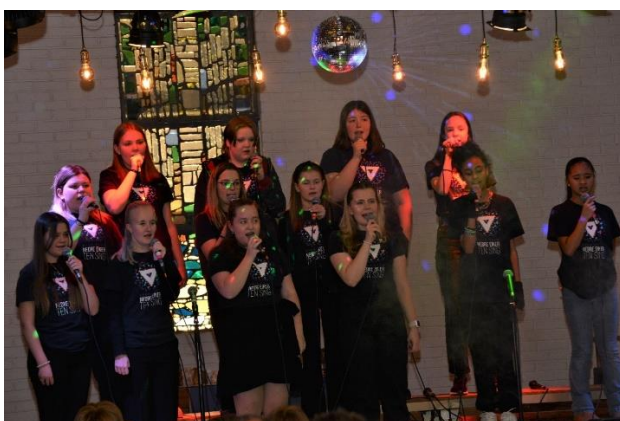
9. desember 2022: NETS julekonsert i Mjøndalen kirke