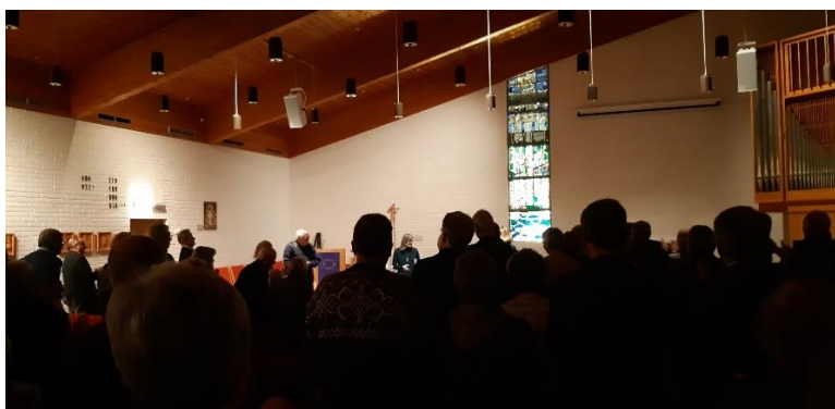
Novemberlys 3. november.