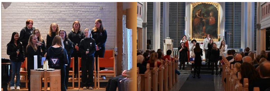
Ung messe i Mjøndalen kirke

En viktig del av arbeidet i NETS er oppfølging av ungdomsledere og samlinger for voksenlederne. 5 NETSere ble sendt på TenSing Seminar til Ulsteinvik på direksjon-, tangenter og styrelederkurs i begynnelsen av august. NETS er helt avhengig av ledertrening, for å dyktiggjøre ungdommene til tjeneste i kor, band, lyd og lys. For oss er det viktig med ungt engasjement og voksen medvirkning.