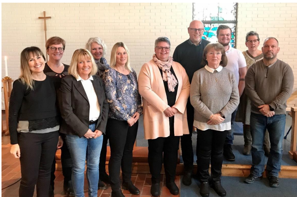
Presentasjon av nytt menighetsråd i gudstjenesten 17.11.19.