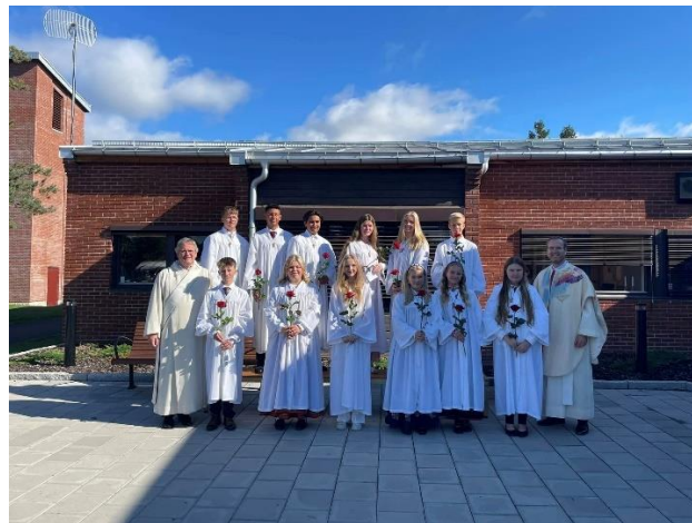
Søndag 11. september