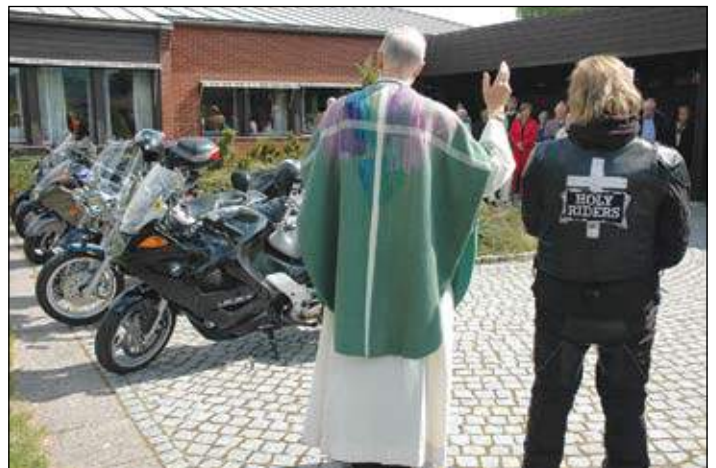
Det ble også en egen velsignelse av motorsykkelsesongen etter gudstjenesten