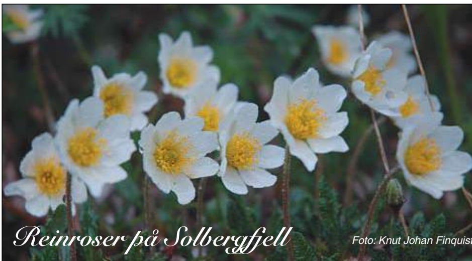
Reinroser på Solbergfjell