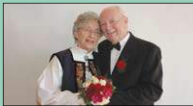
TEMA-NUMMER OM SAMLIV Side 4-6