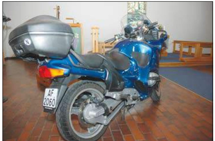
BMW R 1100 RT