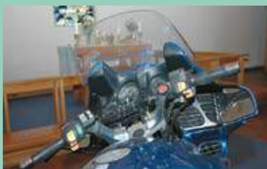
MC-velsignelse Side 7