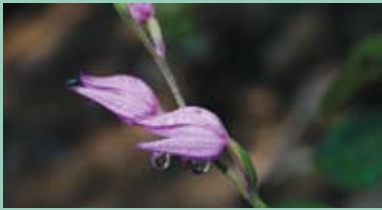
Rød skogfrue – en truet orkidé Side 3