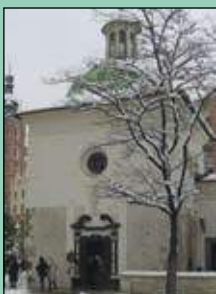
Kirker i utlandet