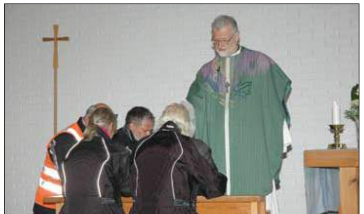
Fra forbønnshandlingen hvor blant annet bikerne ble bedt for