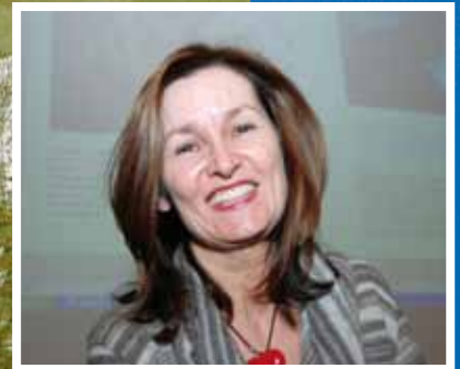
Et godt samliv