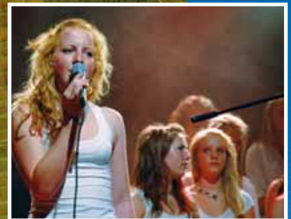
NETS 20 år