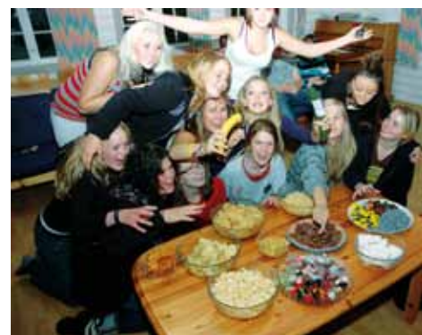
Hyggelig lørdagskveld på Blestølen med deling av snop.