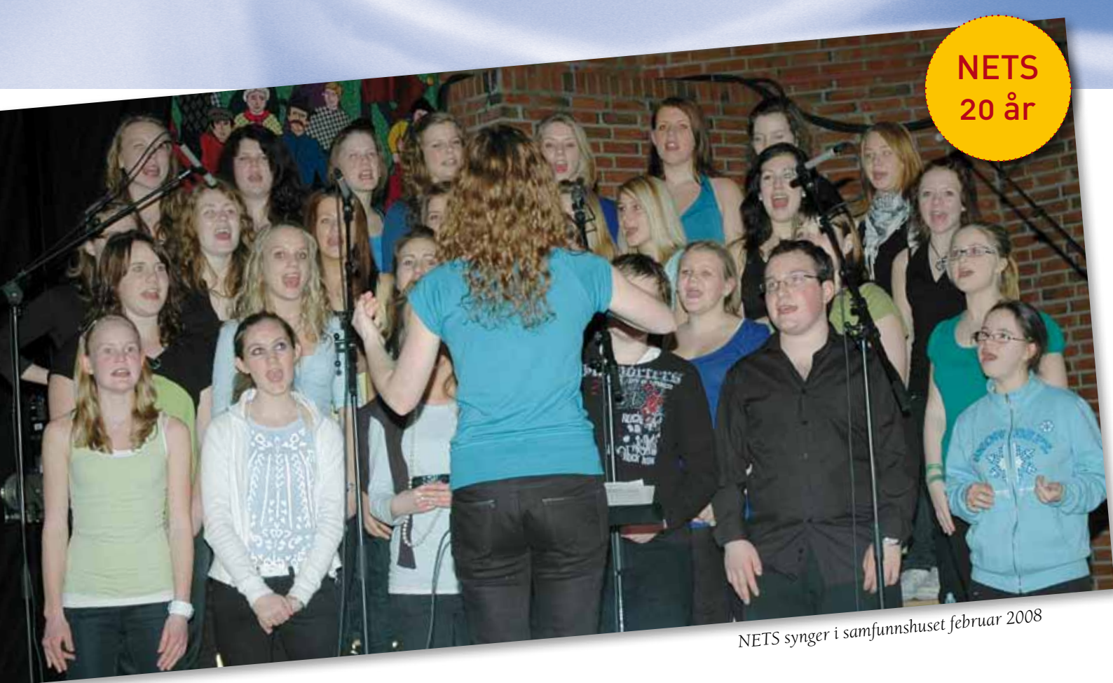
NETS synger i samfunnshuset februar 2008