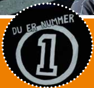
Årets tema «Du er nummer 1»