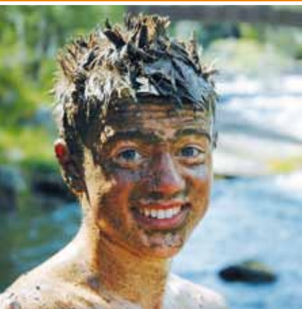
En del av den dyktige heiajengen til Mjøndalen menighet