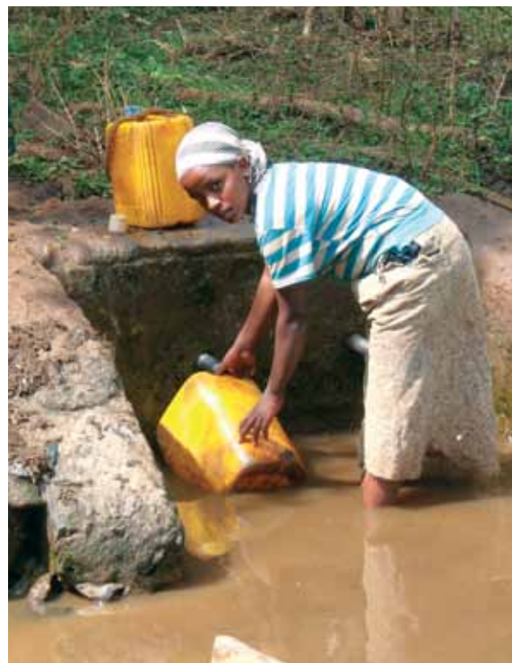
Ung jente som henter vann ved plassen hvor prosjektet sikrer vannet.