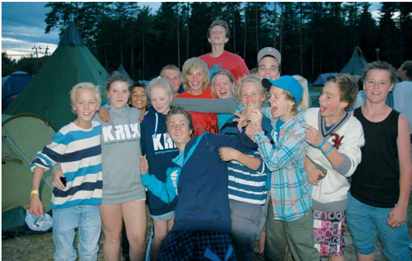
Godt samhold og vennskap blant konfirmanter satte sitt positive preg på konfaksjon 2011.

Hovedvekten av ungdommene velger å bli KRIK-konfirmant. Det å dra på en femdagers leir, sammen med over 900 andre ungdommer fra hele landet, gir en positiv start på konfirmantåret. Ungdommene tilbys ulike aktiviteter, Sommarland i Bø i Telemark, morgen- og kveldsmøter med mye lovsang og forkynnelse tilpasset målgruppen. Andre alternativer som tilbys er NETS-