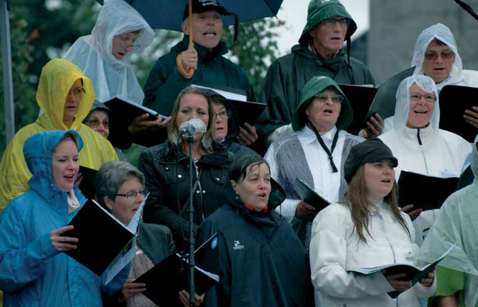
Et sammensatt prosjektkor sang under torggudstjenesten i 2011.