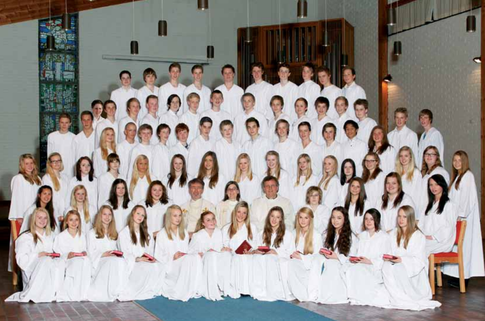
Konfirmantene i Mjøndalen menighet 2011/2012.