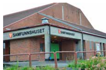
Mjøndalen Samfunnshus (beboere på Ytterkollen stemmer her)

Selve valgtinget åpner offisielt søndag 13. september kl. 12, umiddelbart etter gudstjenesten i Mjøndalen kirke. Da vil alle de 3 lokale stemmestyrene etablere stemmemottak i kirken fram til kl. 14.00. Deretter flytter de utstyret til stemmelokalene hvor stemmingen fortsetter: