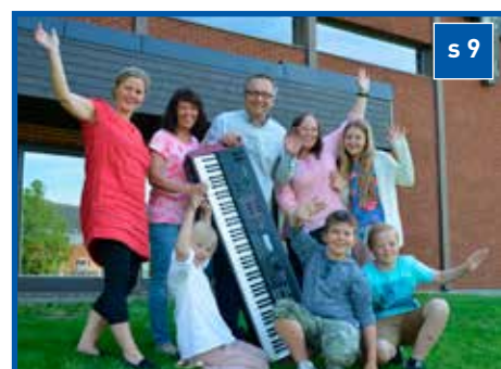
Informasjon om kirkevalget