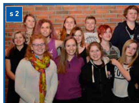
«På flukt fra...»