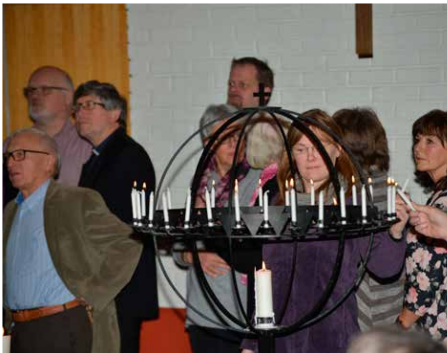
I Familiemessen var det bønnevandring med mulighet for lystenning, nattverd og dåpspåminnelse.

Mange ønsker noen å snakke med om livet sitt, og en del går til coacher og andre veiledere. Ikke alle vet at kirken har lang tradisjon for to typer veiledning: Kirken har både kompetanse på å samtale om livet (sjelesorg) og på å gi mer spesifikk veiledning til å modnes som menneske og i relasjon til Gud (åndelig veiledning). Her er det mange uoppdagede skatter som jeg har lyst til å være med og hente frem.