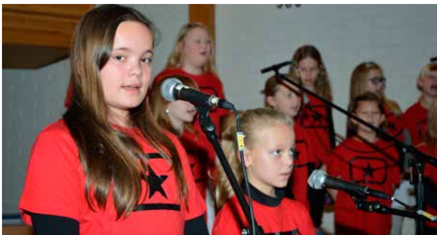
Nedre Eiker Soul Children er et samarbeid mellom Nedre Eiker og Mjøndalen menigheter. Det er andre gang koret synger i Mjøndalen siden oppstarten høsten 2016.