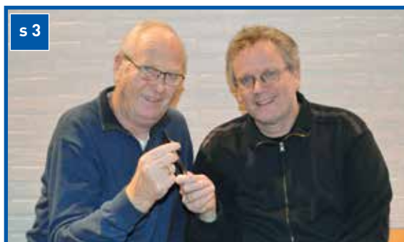
Redaktørskifte i «Sør for elva»