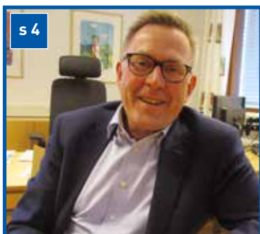
Møt rådmann Truls Hvitstein