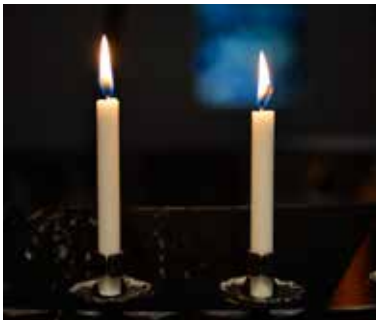
Tenn et lys for deg selv eller en du er bekymret for.