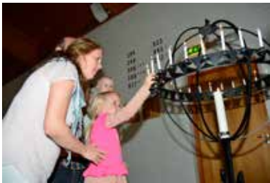
Lysgloben brukes i forbindelse med avslutningen til Mylder.

Har du behov for å komme med livet ditt til en stille stund i kirkerommet? Mjøndalen kirke er åpen for deg alle hverdager kl. 09.00 – 15.00.