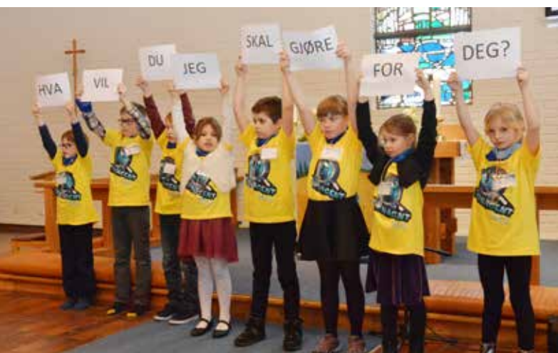
Agentene fikk hvert sitt ark som de skulle sette sammen til et spørsmål. – Hva vil du jeg skal gjøre for deg, var Jesu spørsmål til den blinde. Vikarprest Sletten utfordret oss til å tenke gjennom hva vi ville ha svart hvis vi fikk det samme spørsmålet i dag.

Siste helgen i januar møtte 18 forventningsfulle agenter opp i Mjøndalen kirke for å løse oppdrag og utforske ulike mysterier. Tårnagenthelgen er blitt et populært innslag innenfor menighetens trosopplæring. Målgruppen er barn i 3. klasse, men i år var 2.klassinger også invitert. 5 ungdomsledere og 4 ansatte hadde ansvaret for å legge til rette ulike programposter og pizza til sultne agenter. - Det var ikke gøy, men SUPERGØY, var tilbakemeldingen fra ei av jentene. Tekst og foto: Knut Johan Finquist