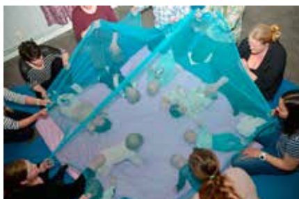
Babysang tilbyr ulike aktiviteter. Velkommen til et inkluderende fellesskap.

20. februar 06., 13., 20. og 27. mars 03. og 24. april 08. mai