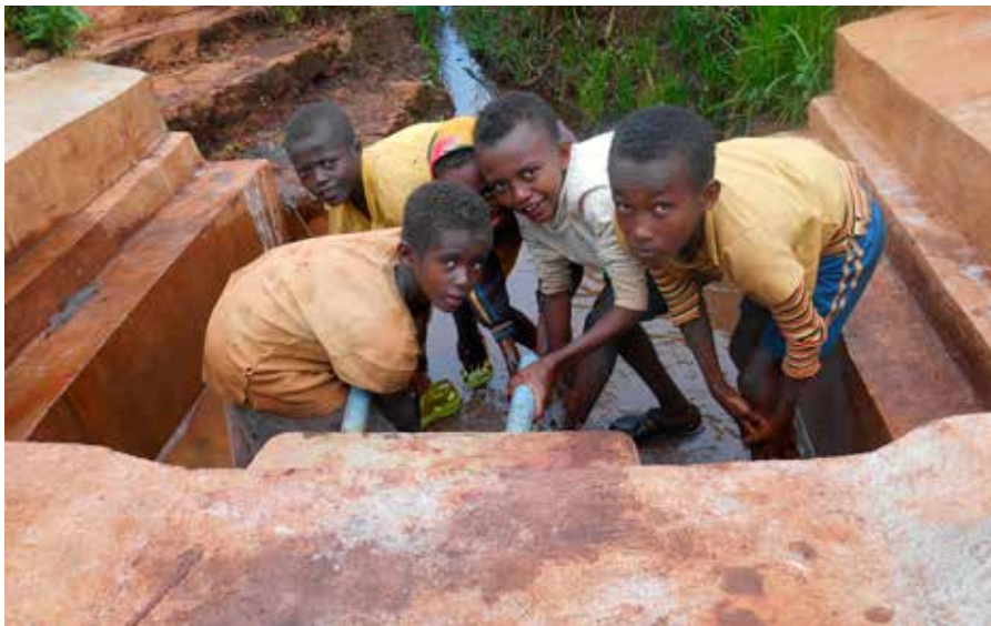
MAO OG KOMO er den opprinnelige befolkningen i Begi og Tongo området, helt vest i Etiopia. I dag er de usynliggjort, glemt og fortiet.

Et at de tiltakene som Mjøndalen menighet støtter er utviklingsprogrammet Green Livelihood. Programmet har forskjellige aktiviteter innen landbruk og miljø, helse, støtte til utdanning, styrking av grasrotorganisasjoner og lokalsamfunn. Bøndene har funnet ut at det nytter å samarbeide for å komme ut av fattigdom. Når lokalsamfunnet hjelper