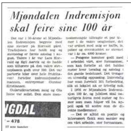
Faksimile fra Drammens Tidende 12. august 1974.