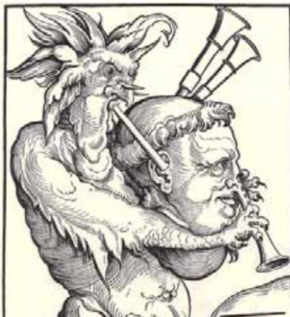
Luther ble latterliggjort – her som «Djevelens sekkepipe». Karikaturer er en gammel kunst.

Og når sant skal sies; Martin hadde fått mange venner, både i folket og blant rikets mektige, og fikk dermed fritt utvikle sin lære i de etterfølgende årene.