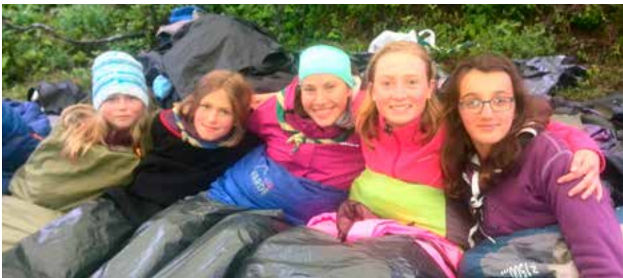
Glade jenter på overnatting i det fri.

De første dagene på leir går med til å slå opp telt og bygge bord og leirplass.