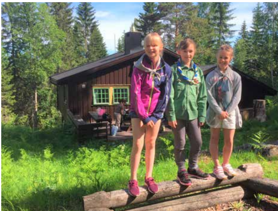
Familiespeiderdag på speiderhytta ved Grytjern.