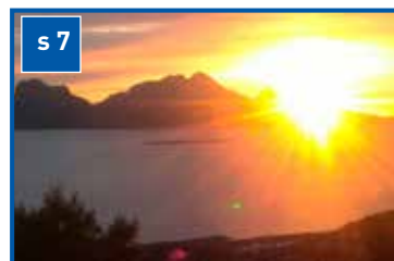
NETS – kor med muligheter