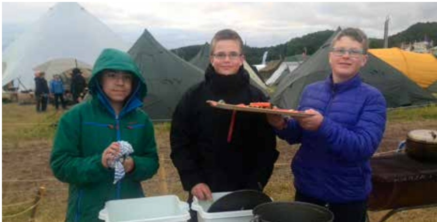
Gutta har kjøkkentjeneste.

Deretter var det aktiviteter som å lage godteri på bål, kjøre zip-line, lage strikkmotorbåt og løse oppgaver for å komme ut av "escape room". Speiderne kunne også lage smykke, nøkkelring og tennstål-håndtak av geviret fra reinsdyr. Noen synes det morsomste var å prate med speiderne i nabogruppa og få nye speidervenner. Andre likte å gå i kiosken eller ta leirmerker.