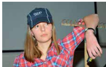
Guro i aksjon under musikalen «Brennende spørsmål».