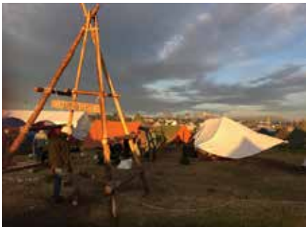
Camp Mjøndalen i speiderleiren.