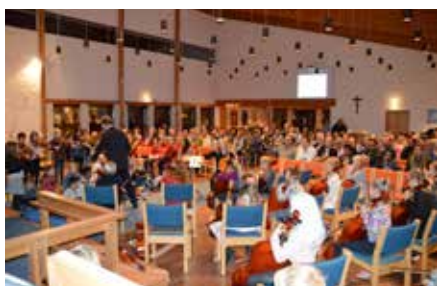
Fullt trøkk fra Steinbergbarnas strykeorkestere

24. oktober arrangerte kulturutvalget FN-kveld for en meget godt besøkt kirke. Det var barn fra ulike skoler i bygda som hadde regien basert på menneskerettigheter og FN's formål. Men det var også sterke kulturinnslag, ikke minst fra «Steinbergbarna» som denne kvelden besto av 40 strykere – fiolinister og cellister - som ga oss en herlig musikkopplevelse. Dette unike musikkprosjektet