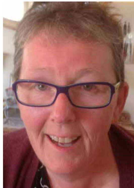
Glimt i øyet