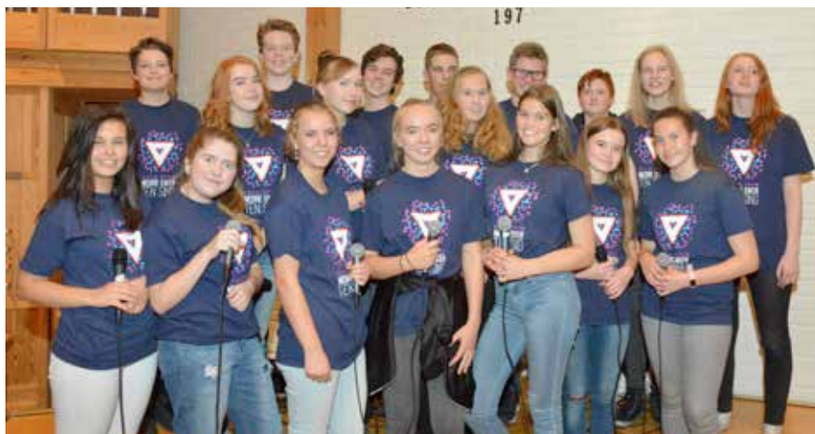
NETS har fått flere nye medlemmer denne høsten.