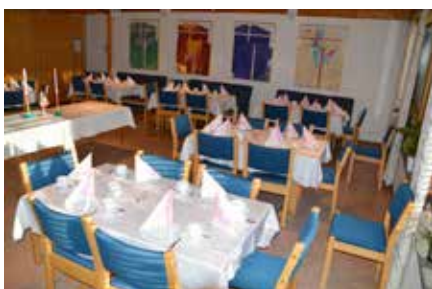
Kirkestua dekket for minnesamvær

Ta gjerne kontakt med kirkekontoret, telefon 32 23 68 60 for mer informasjon, priser og muligheter for øvrig.