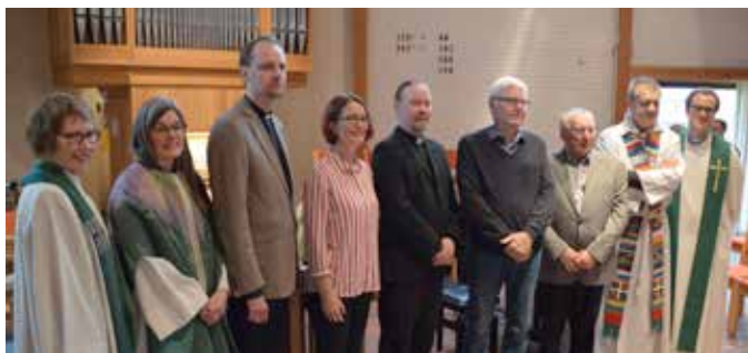
Delegatene fra vennskapsmenighetene