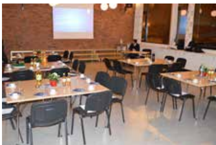
Ungdomssalen som møteplass for lag og foreninger