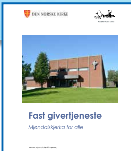
Givertjeneste side 1 og midtbilag