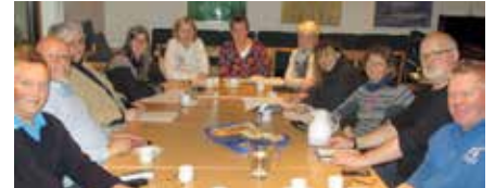
Menighetsrådet har ansvar for menighetens økonomiforvaltning.

i gudstjenestene. Det er menighetsrådet som bestemmer hvilke formål som skal få søndagens offer. Og årlig handler dette om godt over hundre tusen kroner.