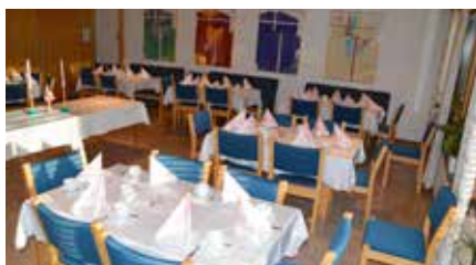
Flott oppdekning til dåpselskap.

Kirken har flere lokaler som egner seg for ulike typer tilstelninger for opp mot 100 personer; kirkestua, peisestua og ungdomsalen som kan slås sammen med peisestua. Det er et velutstyrt kjøkken med det som trengs for små og store anledninger, og leieprisene er fornuftige. Vil du leie? Ta kontakt med kirkekontoret, telefon 32 23 68 60.