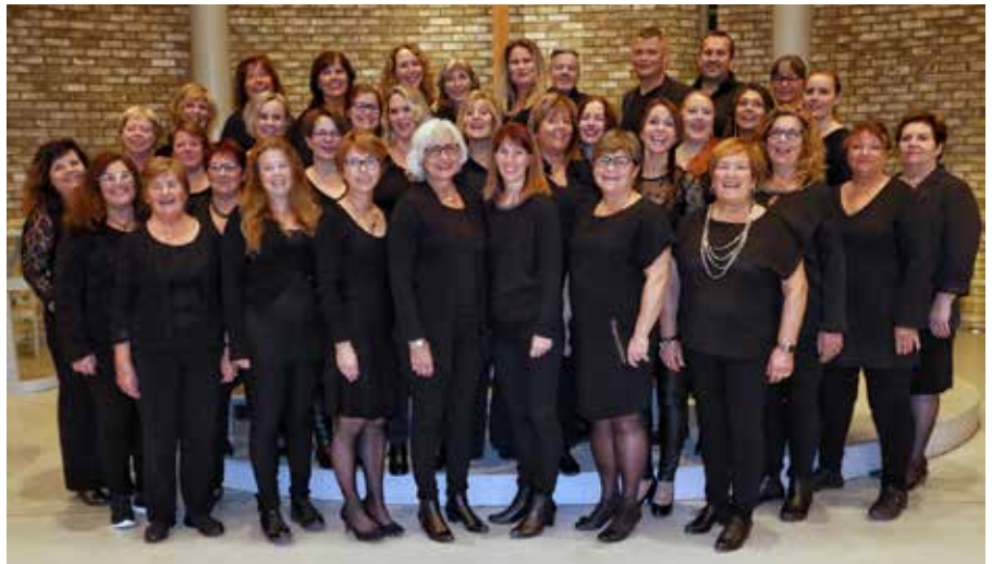
Celebration gospel deltar på torgmessen.

Søndag 27. mai blir det igjen torgmesse på torget i Mjøndalen. I år skal koret Celebration Gospel være med og sette sitt preg på gudstjenesten med glad og smittende gospelsang. Celebration Gospel er et kor under ledelse av Petter Anthon Næss, og består av en flott gjeng