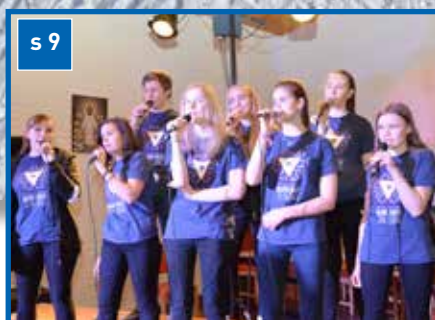
NETS vårkonsert 27.april