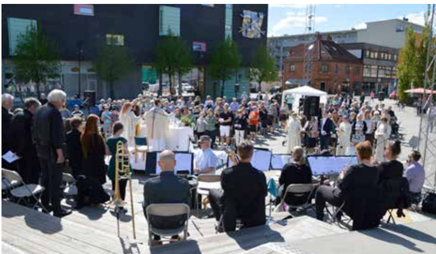
Torgmesse samler mye folk på Orkidetorget.