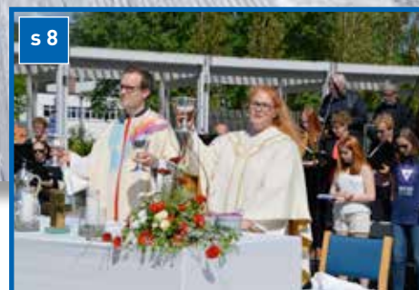
Torgmesse 27. mai