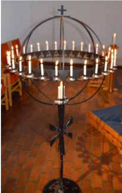
Lysgloben er et sted for stillhet og ettertanke, og er der for deg.