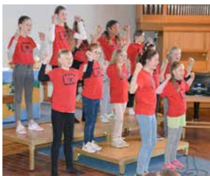
Engasjerte barn med trøkk og sangglede.