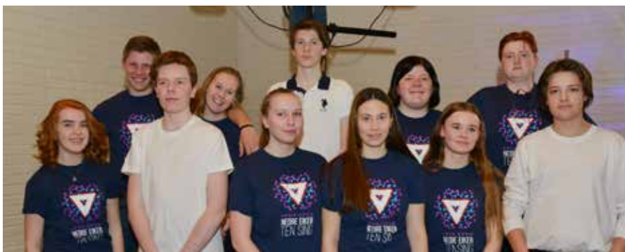
Et flott knippe ungdommer som synger og spiller i NETS.

NETS er et fellesskap hvor det er plass til alle unge. Vi trenger flere korister. NETS er på utkikk etter en som spiller trommer og en ny bassist. Første øvelse etter ferien er fredag 24. august kl. 18 – 21 i Mjøndalen kirke.