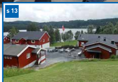
Tabor – Katedralen på Mjøndalsskauen