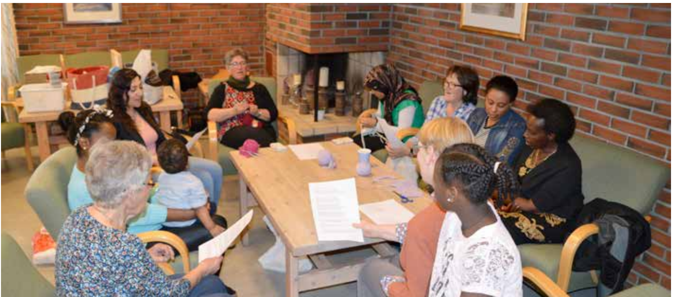
Praten går når gruppen er samlet rundt bordet.