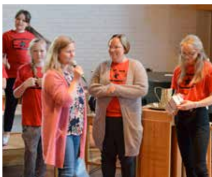
Dirigenten fikk takk fra korets ledere.

Konserten ble også en avskjed med dirigenten; hun forlater oss for å ta fatt på studier. Så nå må koret ut å lete etter ny dirigent – kan det være deg? Se mer om Nedre Eiker Soul Children på side 11.