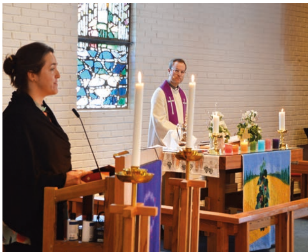
Tilfreds klokker og prest.

28. februar ble en spesiell søndag av to grunner: