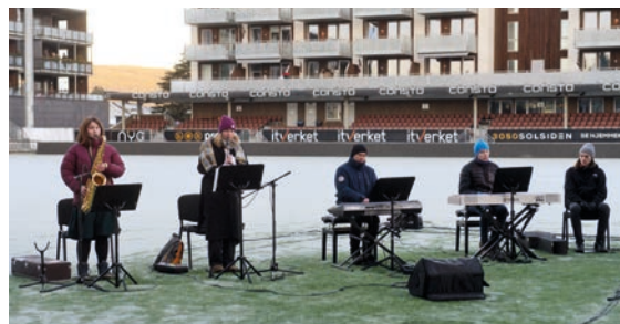
Fra venstre: Mange medvirket i gudstjenesten. - «The Josteins» - dyktige musikere.