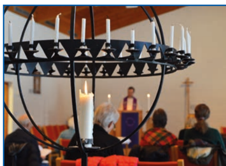
Kan vi fortsatt samles til messe? s 8-9