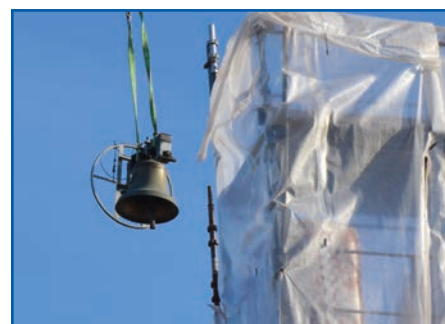
Kirkeklokkene flyttes til nytt tårn s 6