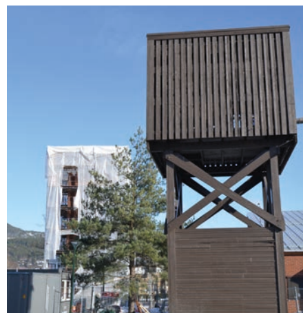
Gamletårnet har gjort nytten sin.

Så var det samtidig slik at da klokkene ringte sine 9 slag ved messeslutt, var det siste gangen det ble ringt fra det gamle tårnet. 2. mars ble de heist over i det nye klokketårnet, og vil kalle til gudstjeneste derfra. Det blir spennende å høre om ringingen bærer lenger fra sin nye plass.