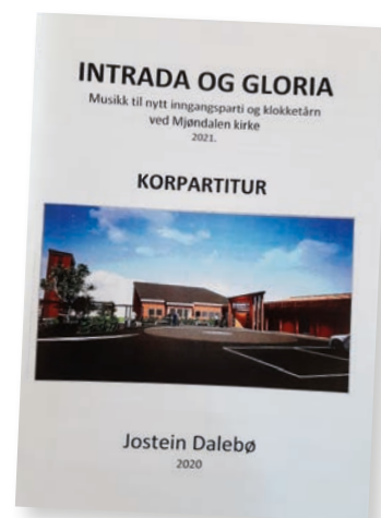
Partitur Intrada og Gloria

Fullstendig festivalprogram - se side 9.