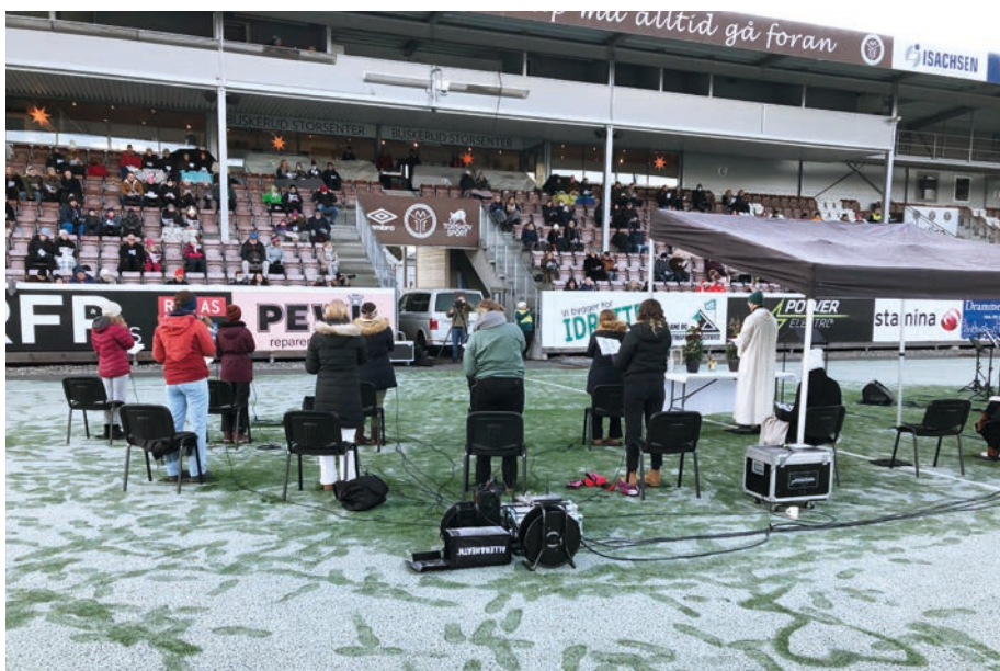
Mye folk og stort opplegg

Mjøndalskerka er jo også en kulturbærer i Mjøndæl'n-samfunnet, som Mjøndalen Idrettsforening, og vi stiller oss bak mottoet: «Lagånd, innsats og kameratskap må alltid gå foran» og «Om vi går opp eller ned vil vi alltid være med».