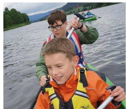
En aktiv hundreåring! Mjøndalsspeiderne har vært på isfiske og kanotur i året som gikk.