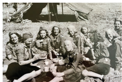
I 1922 var friluftsliv ikke "passende" for jenter, bare for gutter og menn, og jenter skulle ikke bære uniform og eller kniv. Verden har heldigvis gått framover. Mjøndalsjenter på speiderleir like etter krigen.