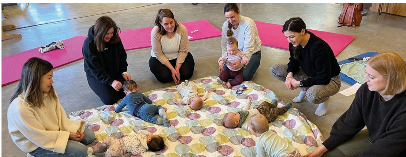
Det ble etter hvert mange barn på babysang.