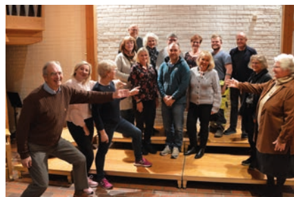
Det valgte menighetsrådet for inneværende periode blir presentert av det foregående.

Høsten 2023 er det kirkevalg og forberedelsene til valget har startet. Første trinn er organisering av nominasjonsprosessen.