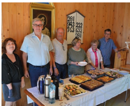
Taborstyret med medhjelpere ønsker velkommen til kirkekaffe.

Dette kulturstedet på Mjøndalsskauen har en spesiell historie som holdes i hevd at et driftig styre, både med godt besøkte gudstjenester og bygningsmessig vedlikehold. Kirkekaffen etter gudstjenesten er berømt, men viktige er det regelmessige vedlikeholdet av stedet. I år er hele bygget vasket og malt utvendig i tillegg til at innvendige vegger ble vasket ned. Det skjer noe hvert år, og flere enn styret selv melder seg til arbeidsinnsats. Det gjør Tabor til en kulturell perle som mange setter stor pris på.