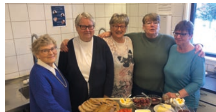
Driftige jenter ordner serveringen.

De månedlige mandagstreffene gleder mange. En 3 timer lang samling med lek, gode samtaler og selvfølgelig litt å bite i. Selv om det er diakon Knut Johan Finquist som har regien, er det flere som bidrar med frivillig innsats.