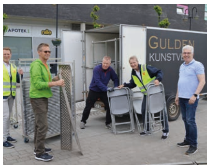
Sjauegjengen med rigging av sitteplasser.

Kirken har noen arrangement som krever litt spesiell arbeidsinnsats. For det første gjelder det planlegging og tilrettelegging for de mange kulturarrangementene i kirken. Vi har i denne presentasjonen valgt å sette fokus på torgmessen, dette årlige arrangementet der kjerka flytter ut til folket. Det er en ganske omfattende jobb