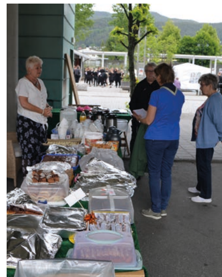
Mange setter pris på strikkegruppas kirkekaffe.

å rigge for en fullverdig festgudstjeneste på torget i Mjøndalen. Lydanlegg, alter, sitteplass til 200, kor- og musikkrigg, trafikkregulering for ikke å snakke om en stor kirkekaffe. Du får flere inntrykk av omfanget i reportasjen på side 6.