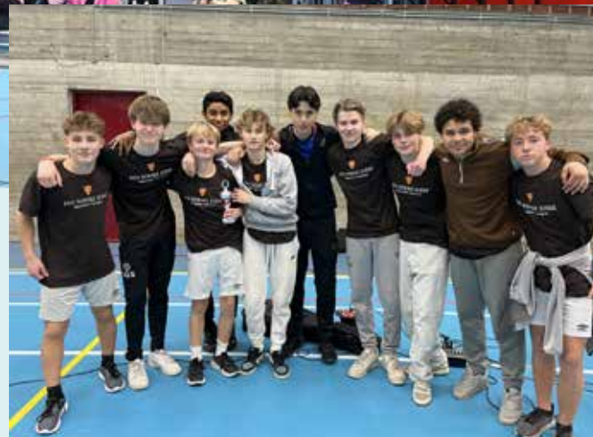
Øverst: 300 konfirmanter var samlet på nattcup i Drammenshallen. Nederst: Konfirmantene fra Mjøndalen vant fotballturneringen.

– De stiller med friskt mot og ungt engasjement der vi «voksne» er og blir voksne. Mange av ungdomslederne kommer igjen år etter år, og vi ser hvordan de utvikler seg til unge, flotte voksne som tar ansvar. Og sist, men ikke minst er dette også en felles arena hvor ungdomslederne treffer igjen ledere de har møtt tidligere. Det er rett og slett hjertevarme og god stemning i disse møtene, presiserer hovedlederen.