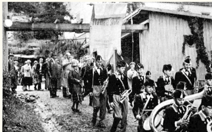
Mandag 16. september 1957 tok et par av småklassene på Nøstet skole i bruk den nye skolen. Glade elever på vei til den nye skolen, i det de marsjerte ut fra den gamle.

Det flotte bygget på Svelvikveien fikk nye funksjoner. Bydelen fikk sitt bibliotek her og en liten gruppe ivrige mødre fikk låne det gamle skolekjøkkenrommet til barnepark etter at de hadde vært i kontakt med