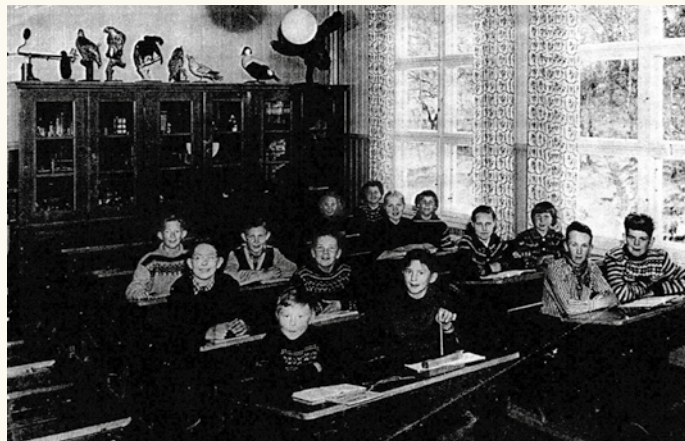
Naturfagtime i 1956 på Nøstet skole. De flotte store vinduene er fortsatt, om enn fornyet, en del av bygget i dag.

kommunen. Bydelen hadde ingen barnehage, og en barnepark som var åpen fire timer noen dager i uken, var et etterlengtet sted, både for barn og mødre. En del av gårdsplassen ble gjerdet inn og her kunne barna boltre seg trygt ute. For de litt større barna åpnet kommunen en ungdomsklubb, som gikk under navnet Hølet.