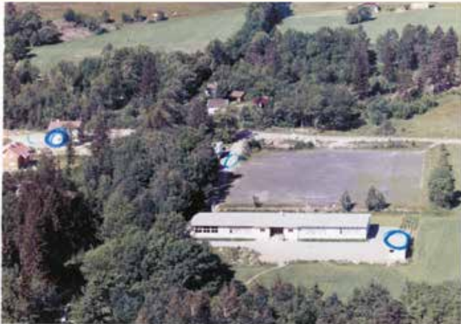
Det nye skolebygget på Åskollen sto ferdig i 1957. Et helt ugjenkjennelig område slik vi finner skole i dag. Dette første skolebygget er revet nå.

Skolene på Tangen har hatt en «møysommelig fødsel», men det viktigste er vel at den oppvoksende generasjon i denne bydelen allerede langt tilbake i tid begynte å få skolegang.