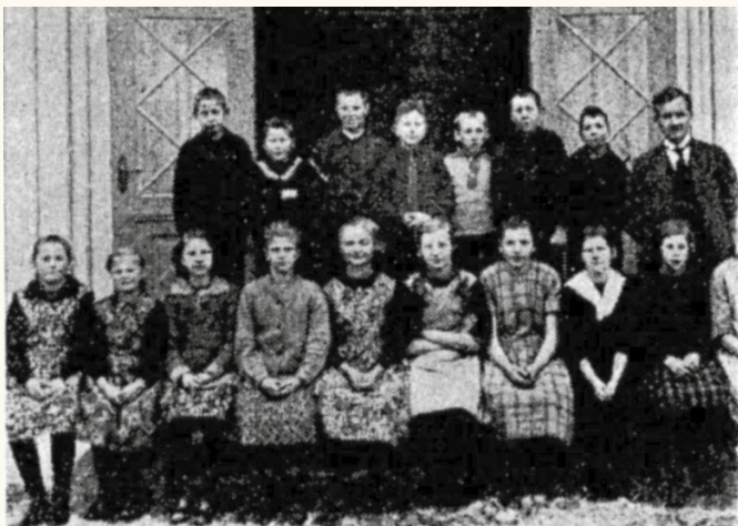
Klassebilde tatt ved inngangspartiet på Nøstet skole fra 1922.

De nye byggene på Åskollen skole har jeg fortalt om i et tidligere nummer av Menighetsbladet. Hele det store komplekset av bygninger Åskollen skole nå er, har fått adressen Tverrliggeren 10.