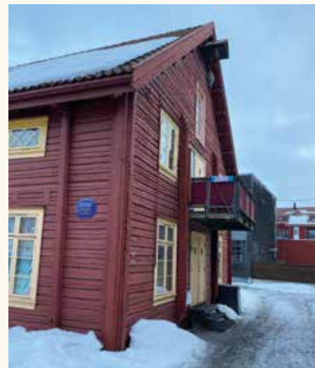
Seilmakerloftet i dag med Blå skilt - Kulturhistorie i kortform