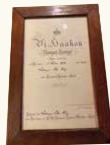
Kong Håkons Forjenest Medalje i Guld fra 1922