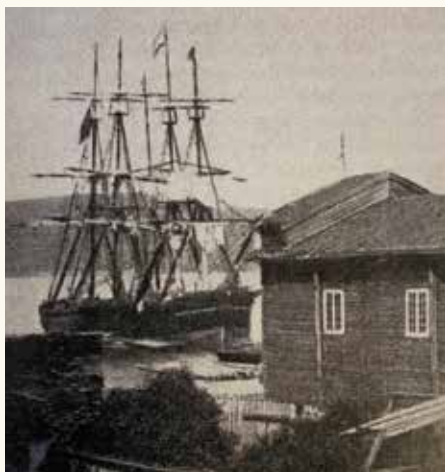
Det gamle seil-loftet som ble bygget i 1850.

Seilmakerloftet var en håndverksbedrift som hadde sin storhetstid under helt andre forhold enn de skipsfarten har i dag. En storhetstid da seilskutene gjorde byen vår Drammen, den gang Strømsø og Bragernes, kjent langt utenfor landets grenser. En bedrift, byens eldste, i Skomakergata på Tangen.