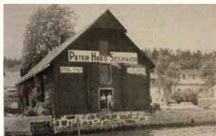
Det nye seil-loftet, bygget i 1870, da det gamle brant ned.