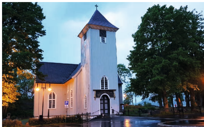
Drøbak kirke i novemberlys. Jeg velger det nære, Drøbak som min greske landsby.