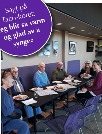
Fra første samling for Tacokoret.

Sagt på Taco-koret: «jeg blir så varm og glad av å synges»