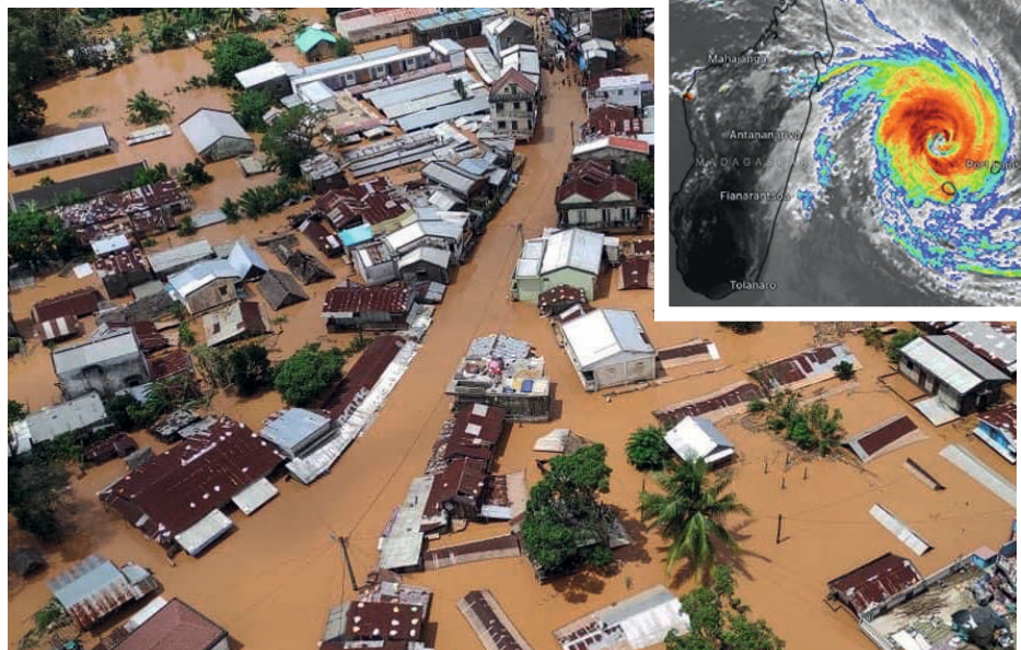
Slik ser det nå ut i Vohipeno by, hvor Fihaonana jordbruksskole ligger. Selve skolen ligger på en høyde utenfor byen og er derfor ikke oversvømt.