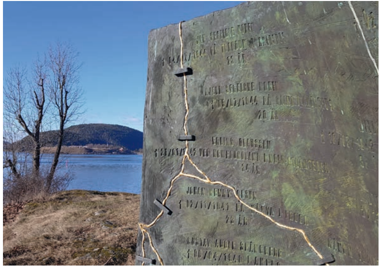
Gullet i sprekken. Fra krig til frihet for oss. Men noen måtte ofre seg. Minnesmerke over de falne i Frogn.