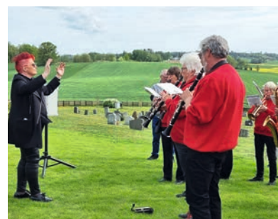
Drøbak Musikkorps bidro musikalsk.