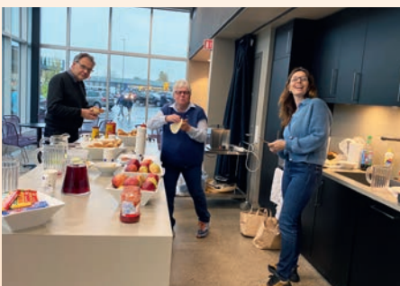
Bli kjent samling: Det er alltid deilig mat når ungdommen samles, og vi er taknemlig for alle som bidrar med servering. Velkomsten begynner allerede i døra. Der blir alle ønsket velkommen, og registrert.

DATOER: 20.11, 15.01, 12.02, 19.03, 16.04, 21.05, 11.06