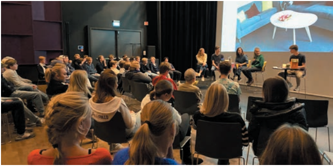
Konfirmantene lyttet spent når panelet svarte på spørsmål om «Hva som skal til for å få et godt liv»