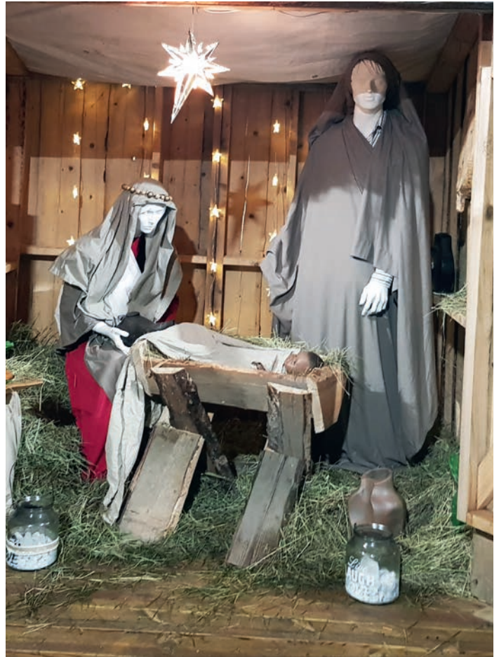
Julekrybben foran Fretex i Drøbak for noen år siden.