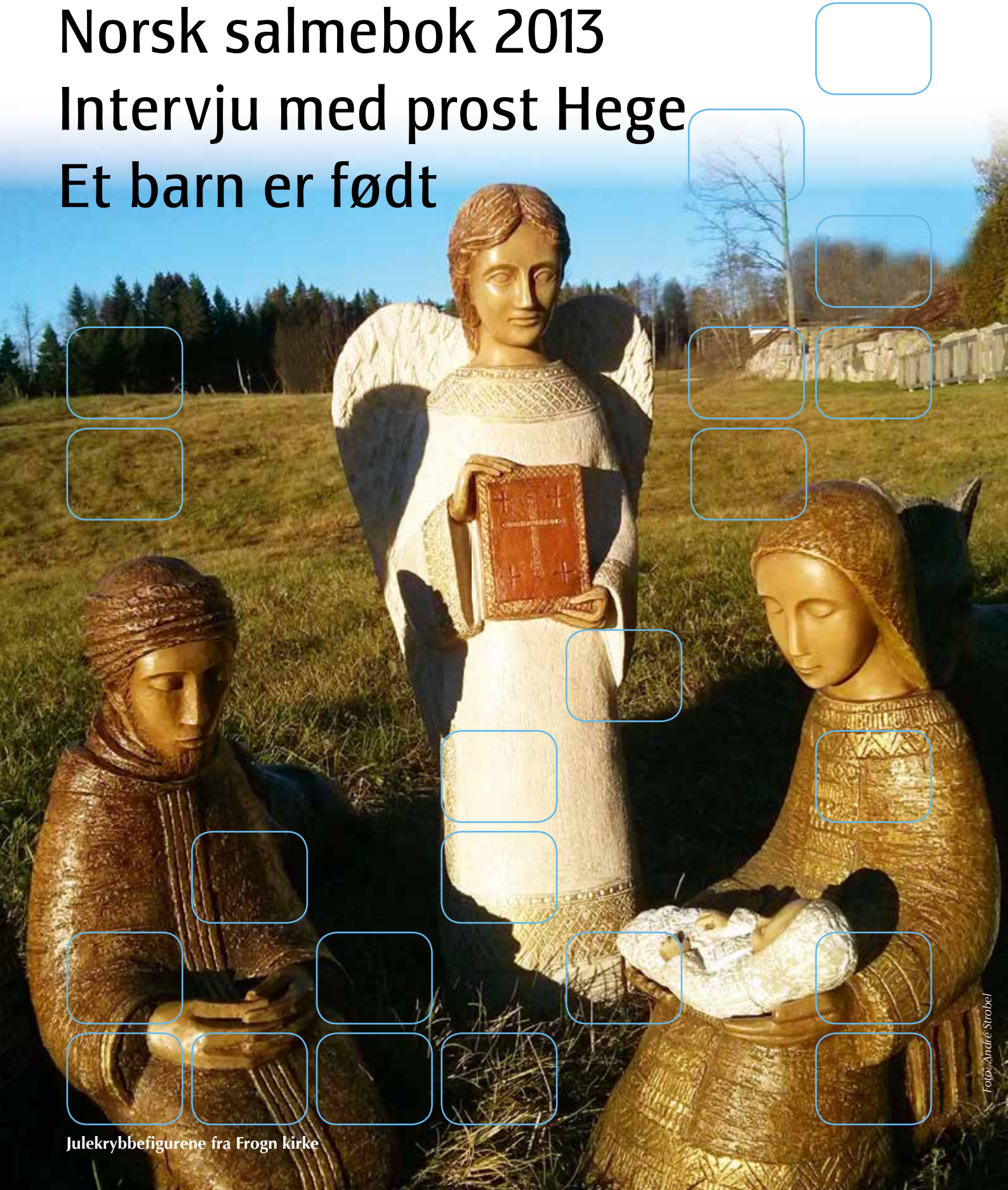
Julekrybbefigurene fra Frogn kirke