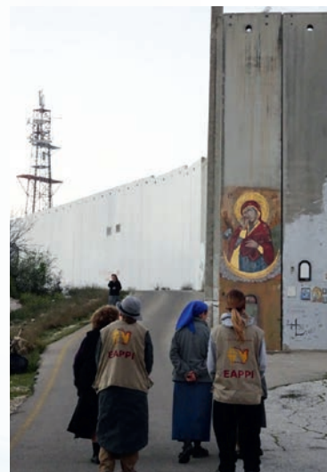
“Prayer along the wall.”

Dette en gammel konflikt. Det er ingen enkle svar. Ansvar for situasjonen må fordeles. Og enhver tenkelig løsning vil være meget smertefull for noen, om det finnes politisk mot til å foreslå og gjennomføre en virkelig og endelig fredsprosess og -løsning. Det er stadig vanskeligere å se noen slike løsninger i dag. I mellomtiden velger noen av oss å være tilstede, et såkalt beskyttende nærvær, for å observere og rapportere og vise kirkelig solidaritet med alle de som lider på alle sider av denne konflikten.