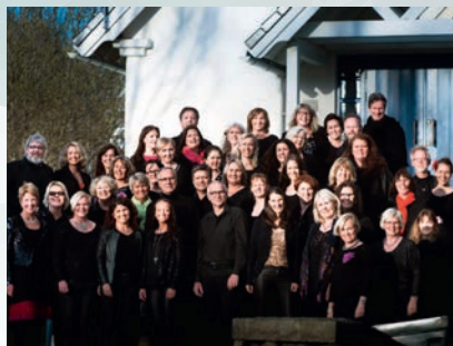
Drøbak Gospel 11.12.