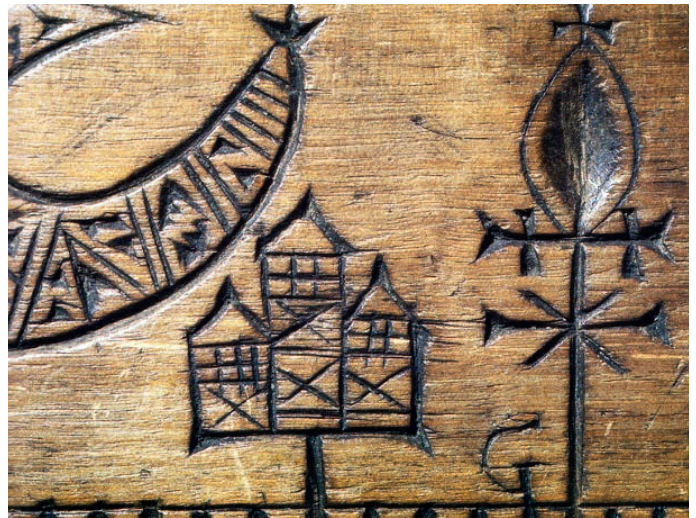
Bildet viser primstaven for juletiden 25. des. - Juledag. Drikkehornet var det sterkeste julesymbolet 1. jan. - Nyttårsdag med kirke som symbol 6. jan. Hellige trekongers dag. Symbolet er tre kors.