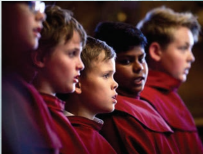
St. Hallvard guttene 4.12.