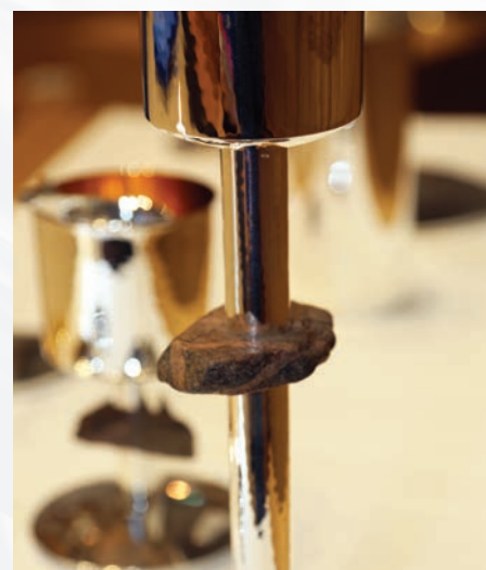
Steinene i kalken og de store lysestaker er samlet inn på Solbergstranda.