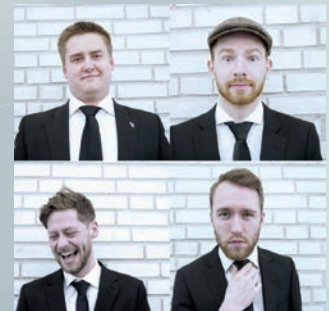
Tre skjeggete menn 19.12.