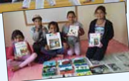
Bilder fra noen aktivitetene på senteret.