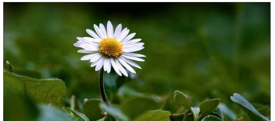
Margarit eller prestekrage