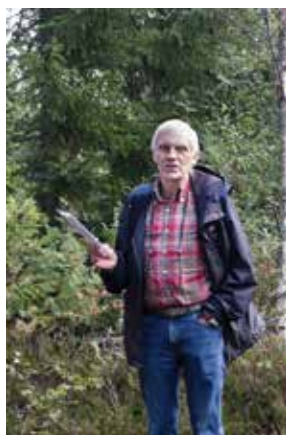
Håkon Tysdal var en god guide med sin kunnskap om den gamle veien.

På det gamle forsamlingshuset «Granly» i Dalefjerdingen var det kafferast, og lokale ildsjeler stilte