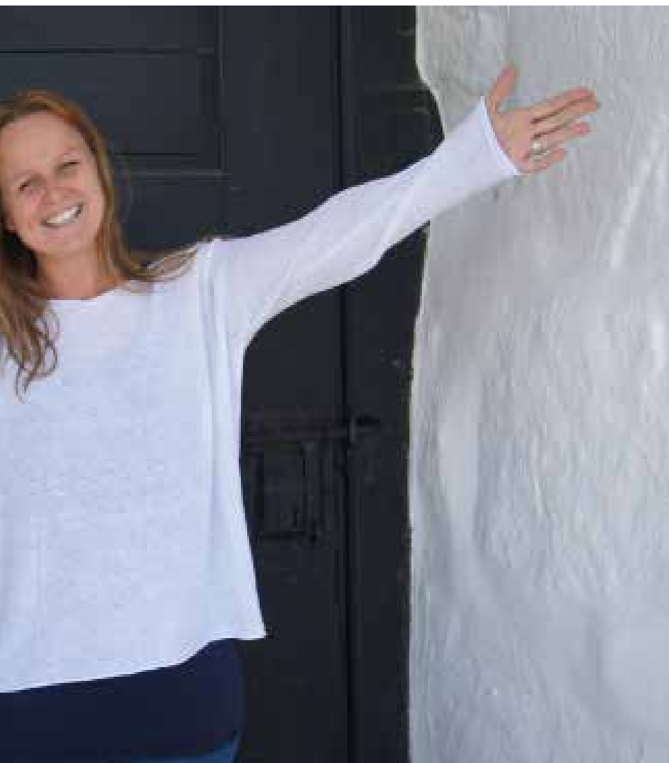
og sunget sammen med kjente artister som Carola og Sissel Kyrkjebø. Nå skal hun ha ansvar seg til å lære barn og unge om Jesus.

Den tida bodde vi i Ytre Enebakk, og jeg engasjerte meg på Misjonshuset, hvor jeg bl.a. var med på å starte barnelaget og Åpen barnehage.