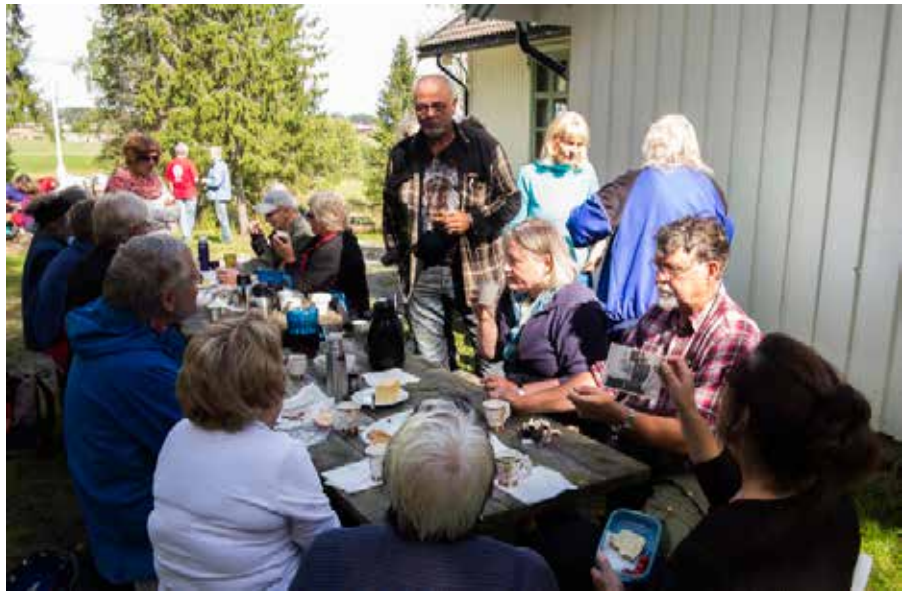
Mat og drikke hører med også under en pilegrimsvandring.

Barnehager og skoler får tilbud om julegudstjeneste eller besøk i adventstiden. Gjelder både Mari og Enebakk.