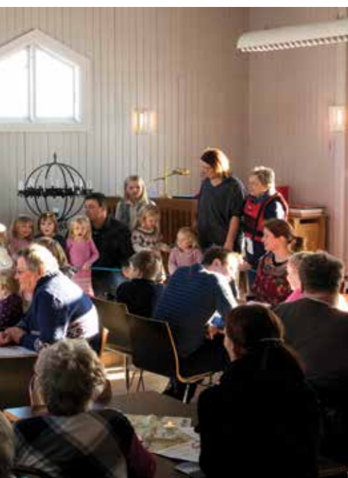
der fireårs-boken ble delt ut.