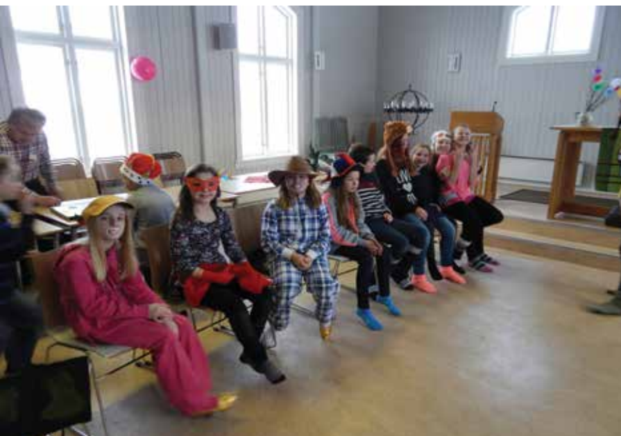
Karneval på «Etter skoletid» vakte stor begeistring.