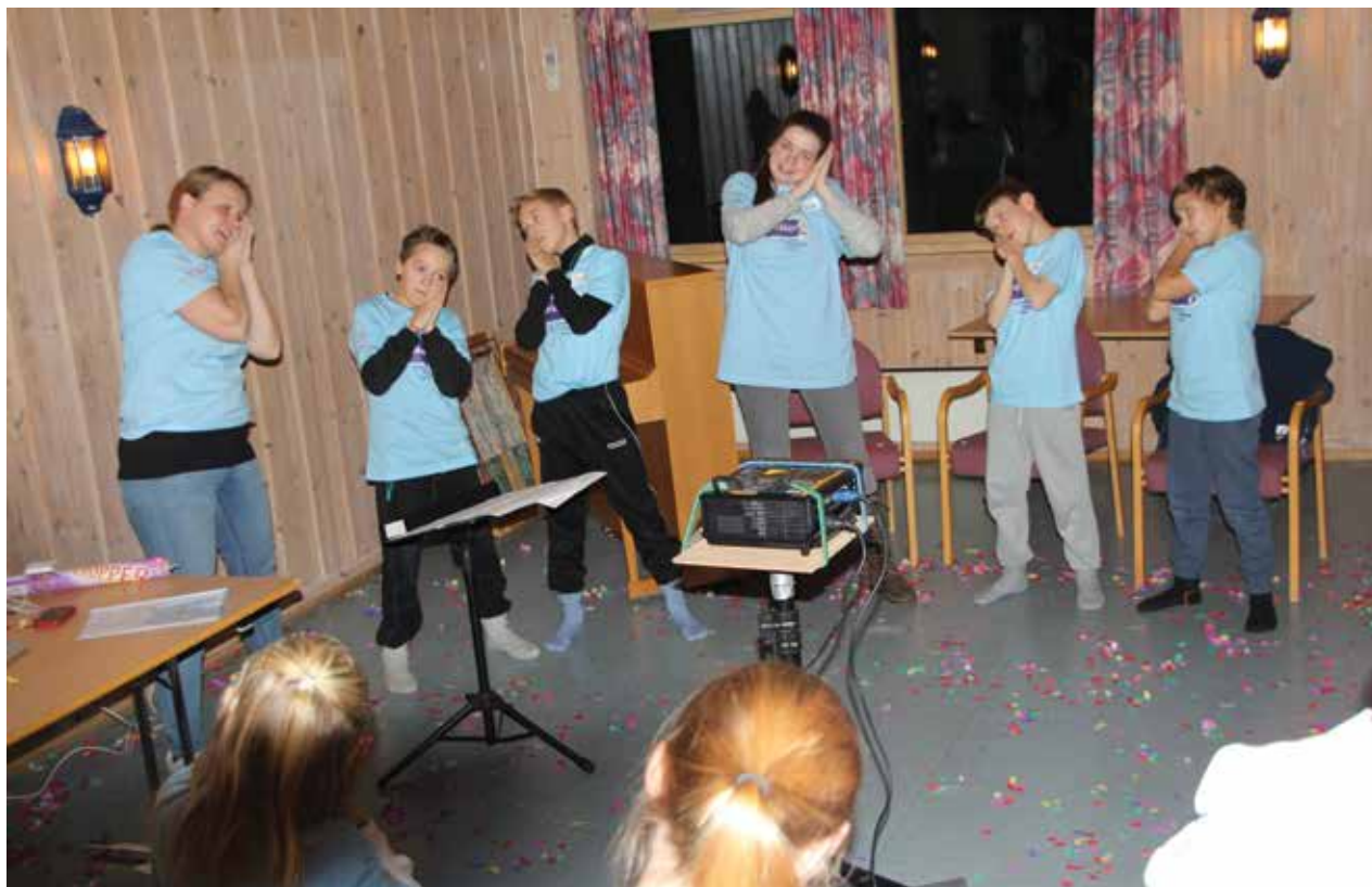
Elleveåringene var ikke vanskelig å engasjere under "Lys Våken"-arrangementet i Mari kirke før jul.

tvers av de kristne organisasjonene i bygda.