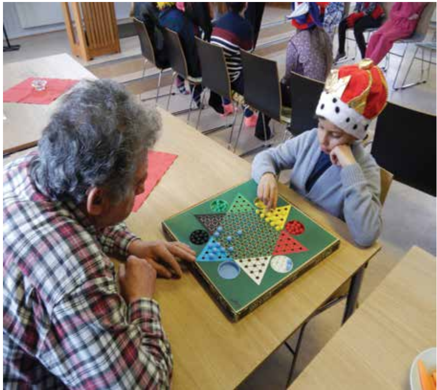
Kinasjakk er et av de populære spillene på «Etter skoletid».

Et måltid mat hører også med til tilbudet på «Etter skoletid» og er