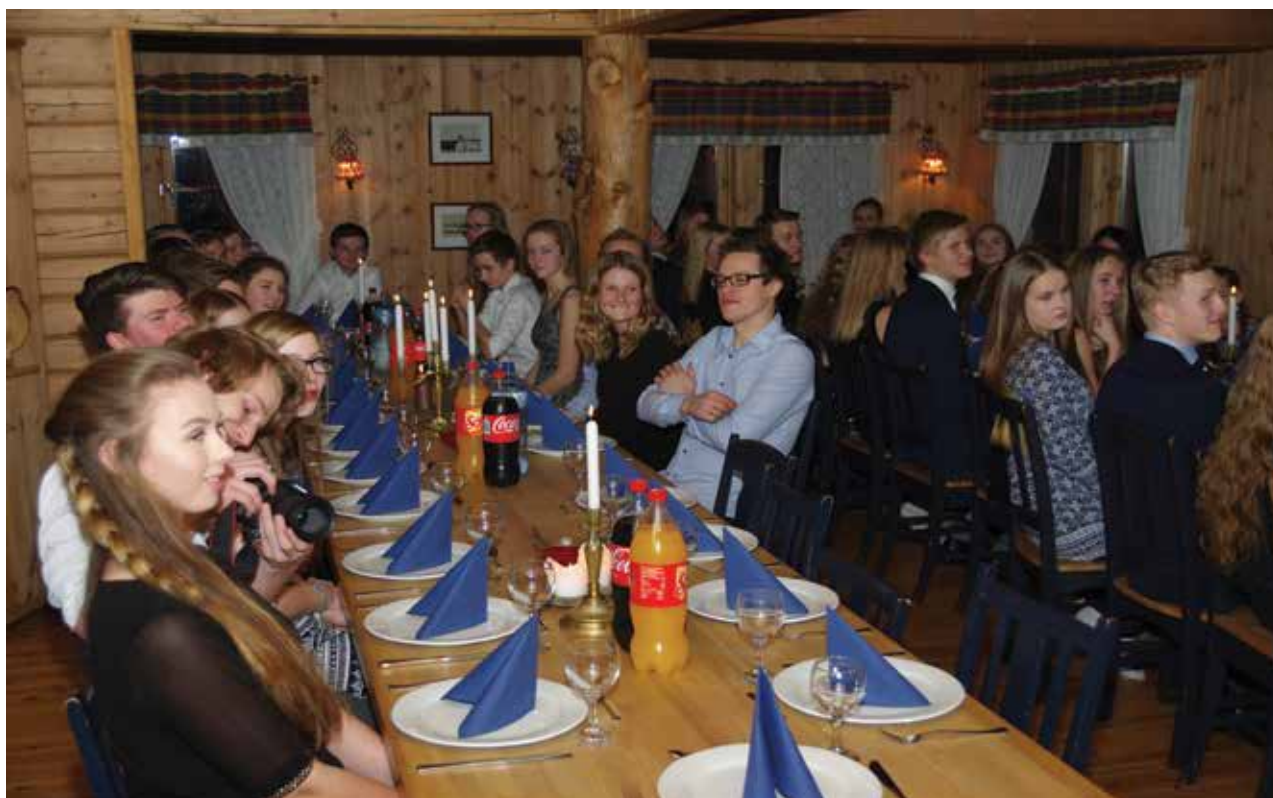
Forventningsfulle ungdommer klare for festmiddag - et av høydepunktene under weekenden.

enn i hverdagen når rammene er litt annerledes. Her er det flott natur, god mat og godt felleskap, sier Anne Opheim.