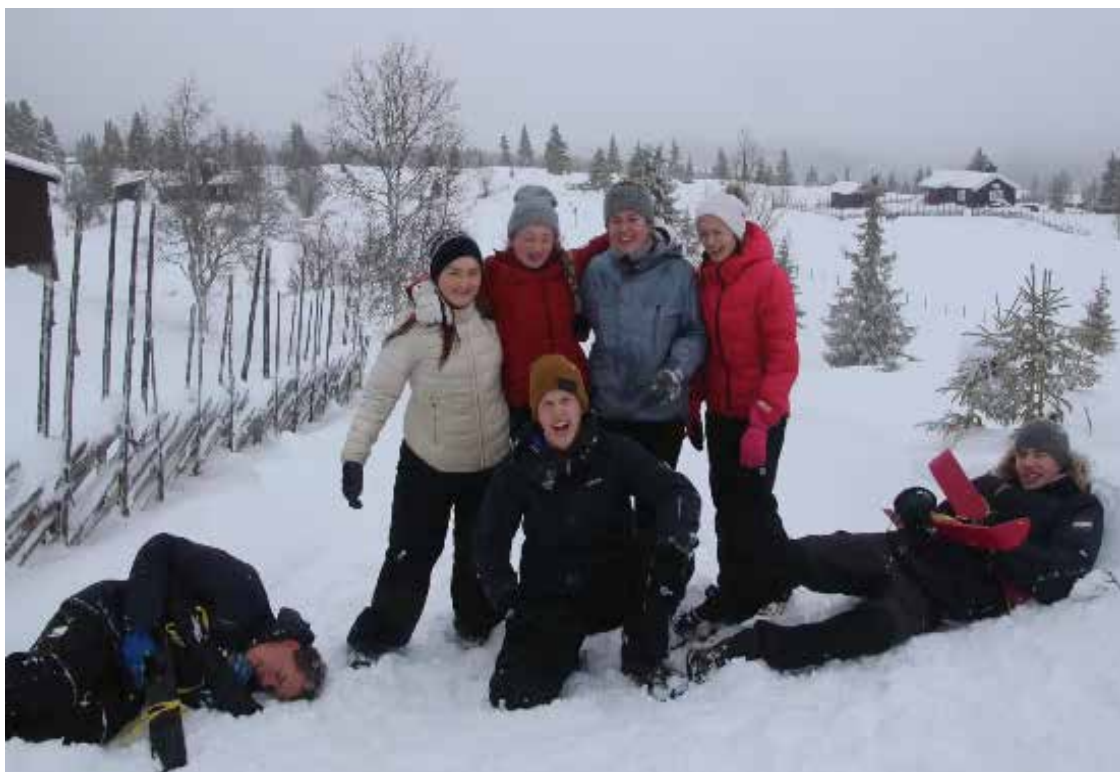
Mye latter og moro hører med på Skotten-turen.

- Det er flott å samle så mange ungdommer til en slik tur uten at det er en spesiell aktivitet som lokker. Vi blir kjent med hverandre på en annen måte