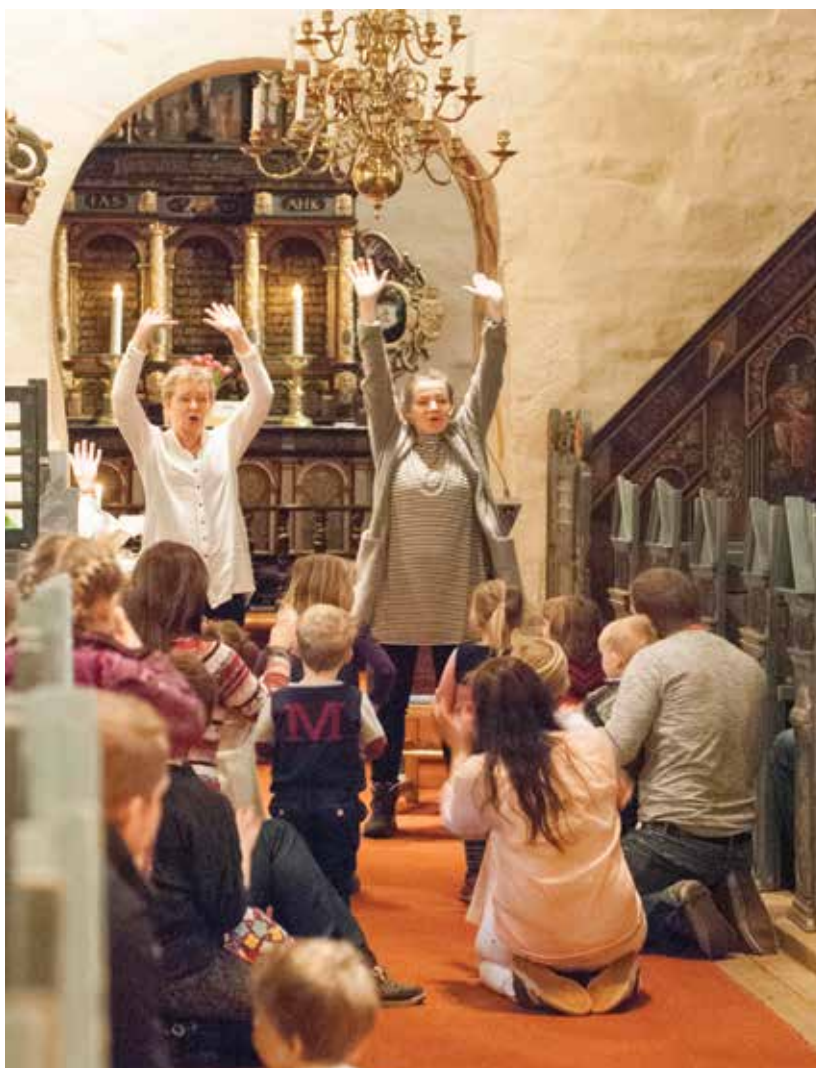
Barnelaget på Emaus var med under 4-åringenes dag i Enebakk kirke.

Etterpå smakte det godt med fastelavnsboller, saft og formingsaktiviteter på Menighets-senteret i Mari, mens tilsvarende i Kirkebygda ble holdt på Emaus.