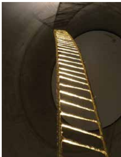
Jakobs stige i Nordlyskatedralen i Alta.