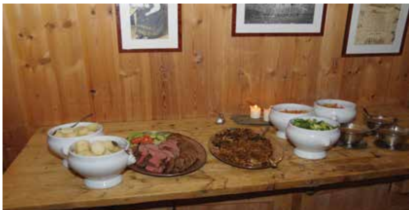
Hovedretten var honningmarinert indrefilet med rotgrønnsaker.

Den som kanskje har flest turer med Emaus til Skotten, er Tore