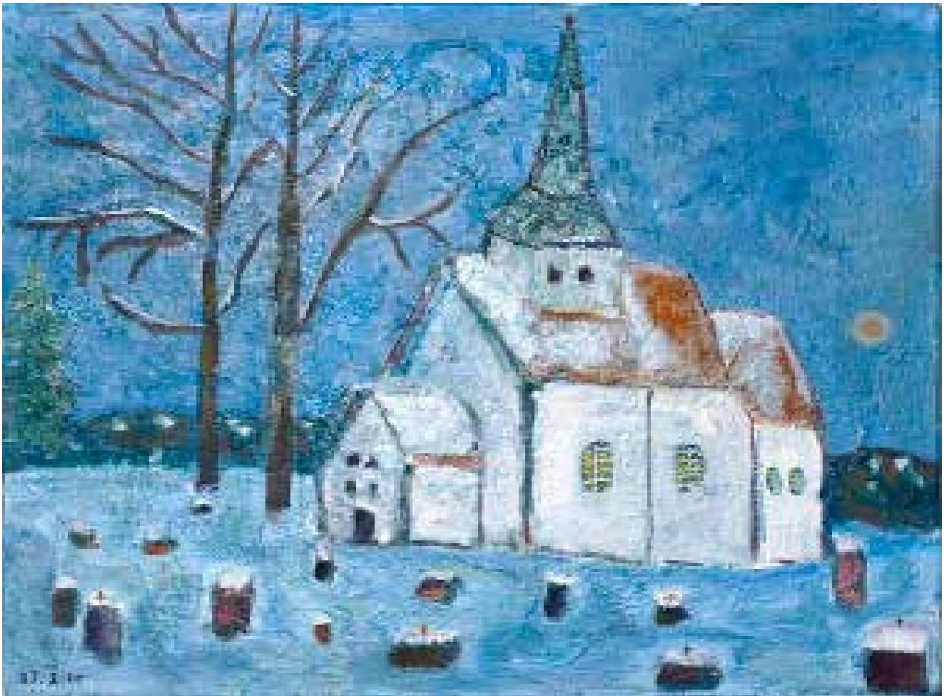
Mari kirke - malt av Ingvild Solberg.