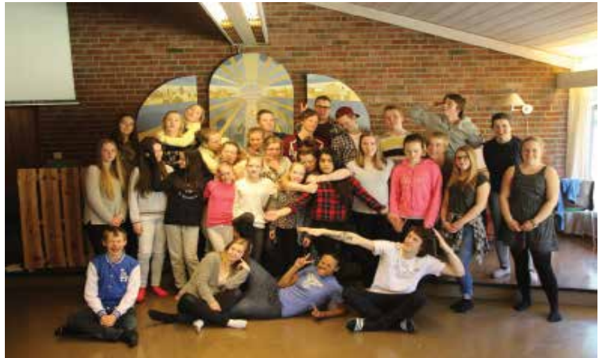
Blant annet til konfirmantarbeidet trengs det frivillige.

Til gudstjenestene er det behov for flere hjelpere til ulike oppgaver. Du kan melde deg som kirkevert, kaffevert eller du kan være medliturg. Kirkeverten ønsker velkommen til gudstjeneste, deler ut salmebøker og program, hjelper til med innsamling av kollekt og