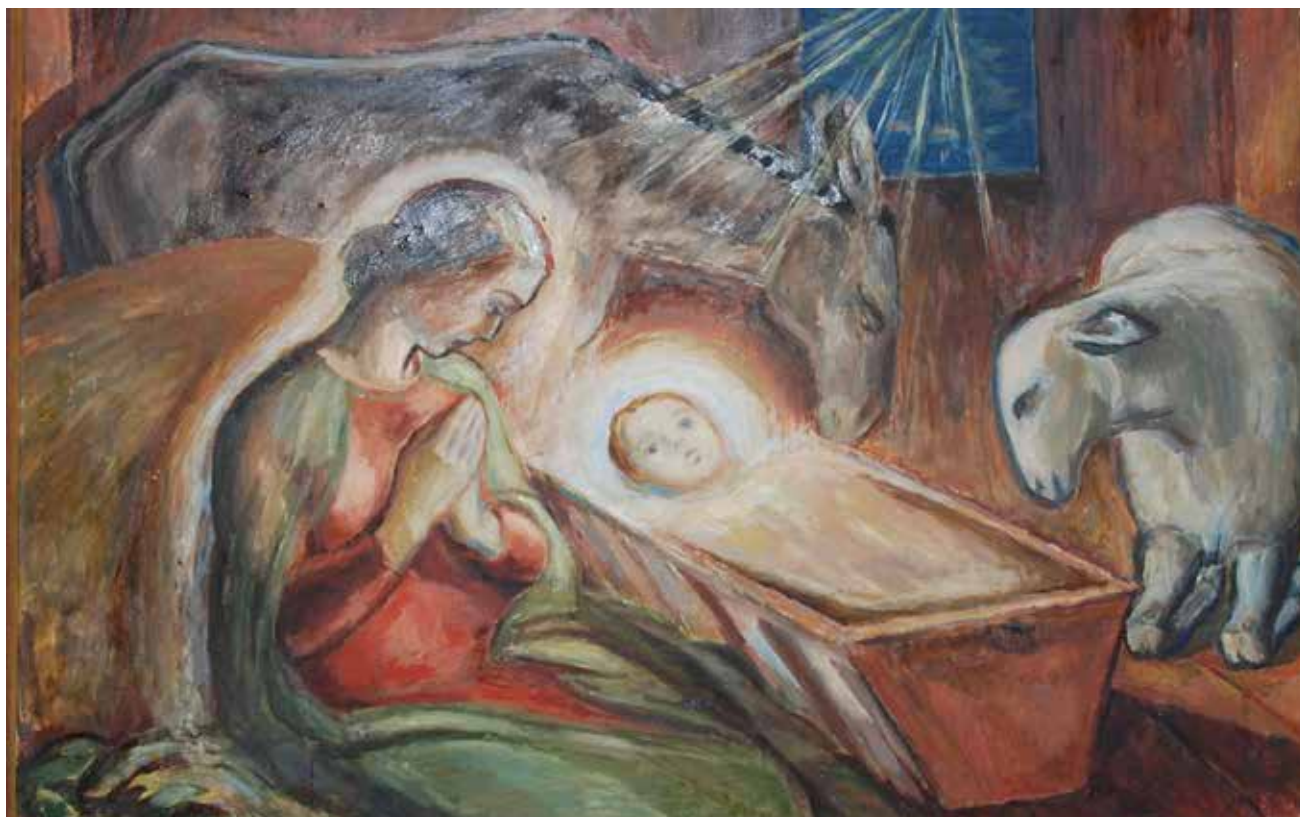
Julenatt. Altertavlen i Tistedal kirke.

i en grotte i bergveggen, med levende husdyr. Og folk strømmet til og kunne gå frem til Jesusbarnet i sine arbeidsklær og med buskapen sin, slik gjeterne gjorde den første julenatten. Slik løftet Frans Gud i Jesus inn i folks og husdyrenes hverdag.