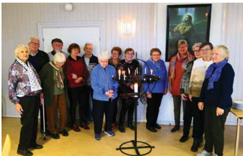
Formiddagstreff i en hyggelig og trivelig atmosfære på Flateby menighetshus.