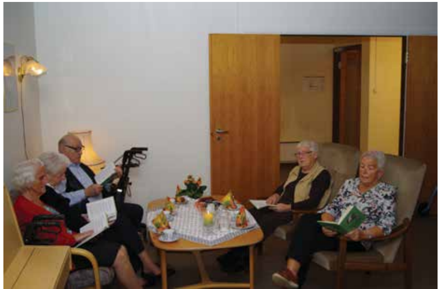
Allsangen fyller dagligstua på Ødegårdstun med glede og god stemning.

Siden det er en ekstra samling, så er det Berit som står for mu-