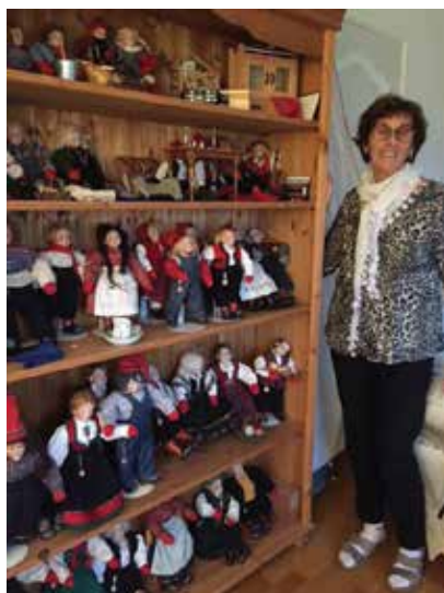
Her er nissesamlingen.