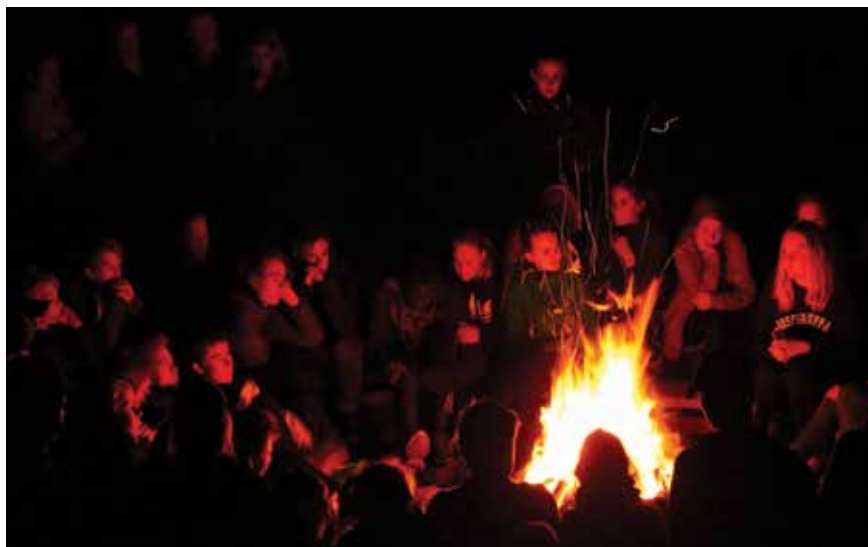
En hyggelig samlingsstund rundt leirbålet er et eksempel på noe som kan være med på å skape kontakt og gode relasjoner. Her fra en konfirmantsamling.

Han peker på at menighetene nylig har utarbeidet og vedtatt en omfattende diakoniplan, som vil danne grunnlaget for ungdomsdiakonens arbeid.