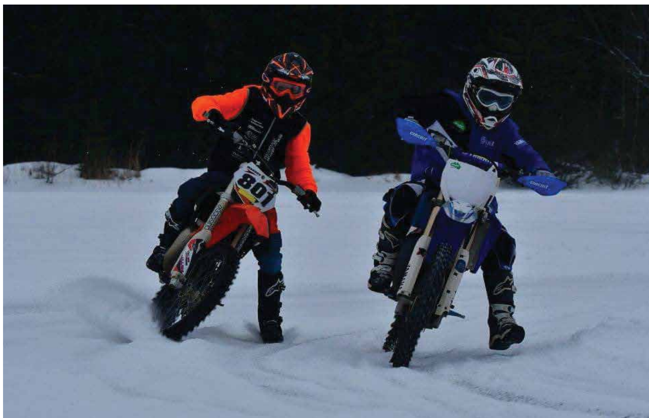
Motorsportsklubben sørget for fart og spenning.