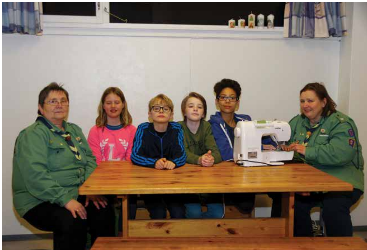
Aktiv KFUK-KFUM-speidergruppe på Flateby med plass til enda flere.

vært borte et eneste møte. Det morsomste er å ta merker og dra på overnattingsturer. Jeg har bålmerke, futuramerke og geocaching, forteller Josef.