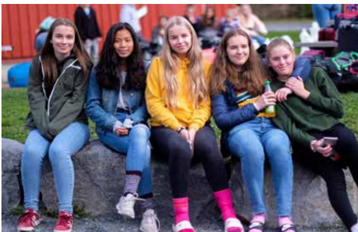
En glad gjeng som så ut til å kose seg.

Søndag morgen feires det gudstjeneste, og en strøm av trøtte men blide konfirmanter går mot nattverdbordet og tar imot de synlige tegn på Gud grensesprengende kjærlighet. «Dette er Jesu legeme» «Dette er Jesu blod». Og konfirmanter mottar dette midt i sine unge, nysgjerrige, prøvende, søkende liv. Konfirmantleir er Mission Possible!