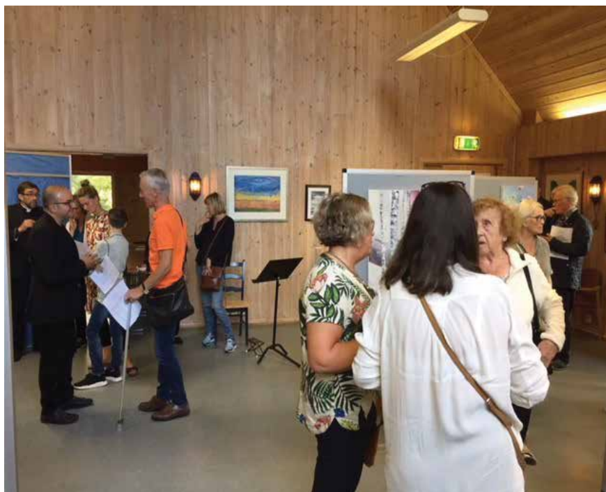
Det var stor interesse for kunstutstillingen, der lokale kunstnere presenterte egne verker.

gjennom flere tiår hatt engasjementer i norske symfoniorkestre og ved Operaen. Trond Bjerkholt er tenor, utdannet ved Grieg akademiet og ansatt ved Den norske opera.