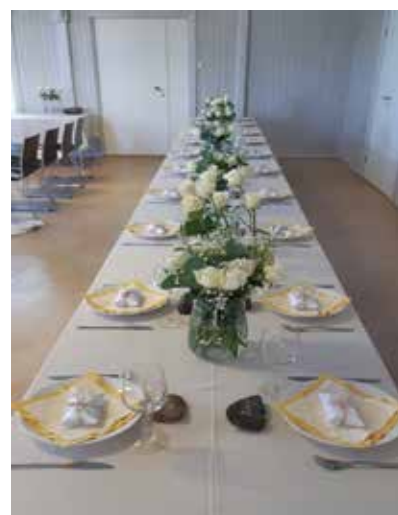
Stilig festbord på Flateby menighetshus

Vi tar alltid imot våre brudepar med takknemlighet og glede enten man ønsker en