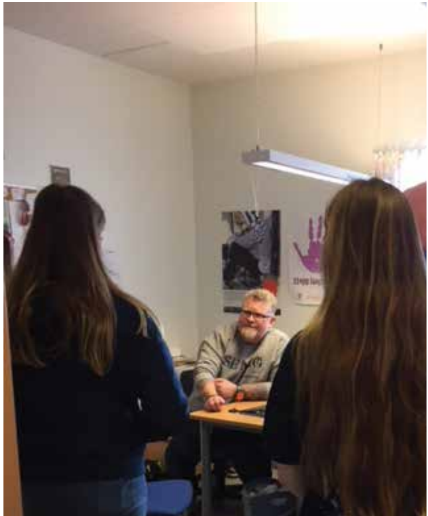
Mange unge i Enebakk trenger hjelp, og du kan være med å hjelpe.