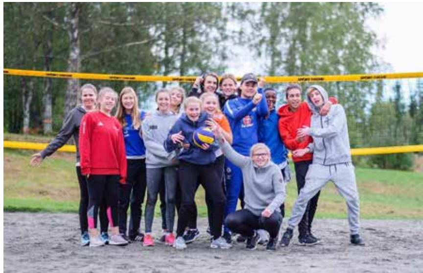
Ivrig konfirmanter deltok i de mange aktivitetene på leiren.

Lørdagen ble en lang, innholdsrik dag. To ganger var det un-