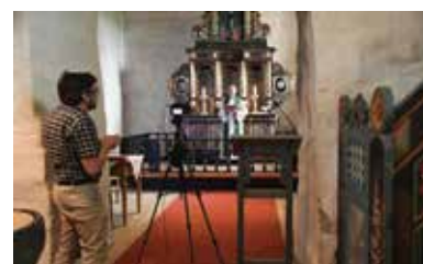
Fra optakene i Enebakk kirke.