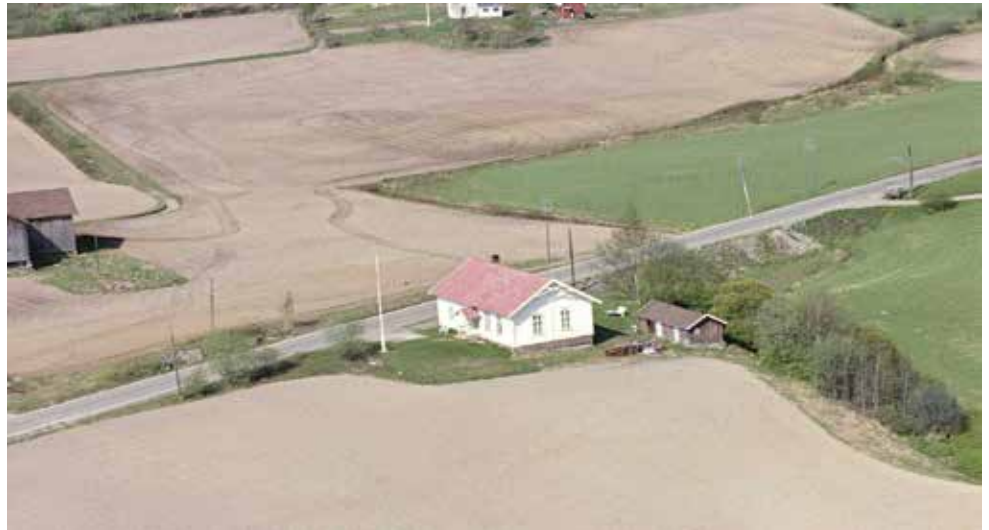
Stranden bedehus, nå Flateby menighetshus, skal flyttes inne på tomten for å få plass til dobbel gang- og sykkelvei langs veien.

Områdereguleringsplanen for Flateby sentrum ble vedtatt av Enebakk kommunestyre i september 2018. Gravplassen er en del av denne planen, og arealet er klargjort og godkjent for