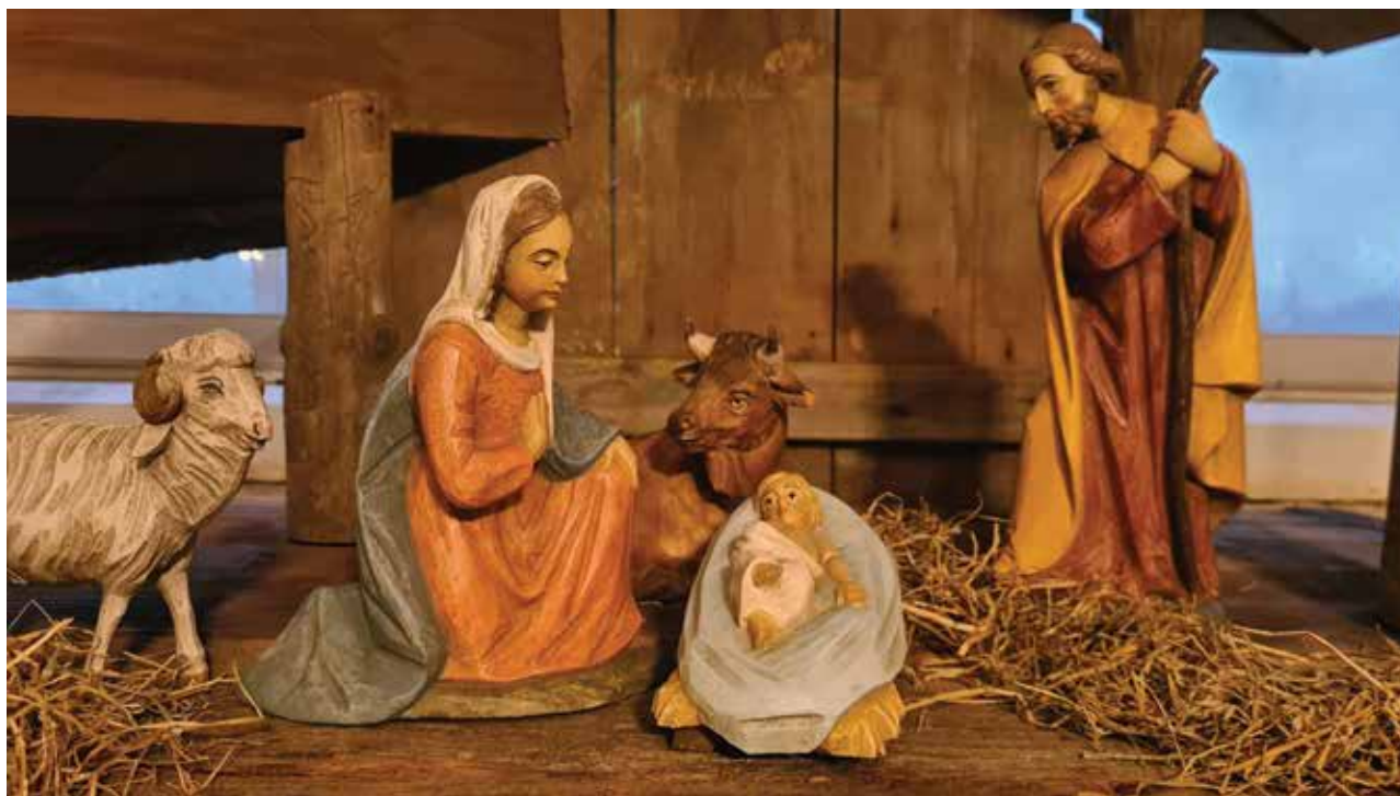
Stallen i Enebakk kirke.

fange av menneskets logikk og tankekraft. Gud er Gud om alle mann – og kvinner, var døde, som Petter Dass skriver i Den norske kirkes nasjonalsalme.