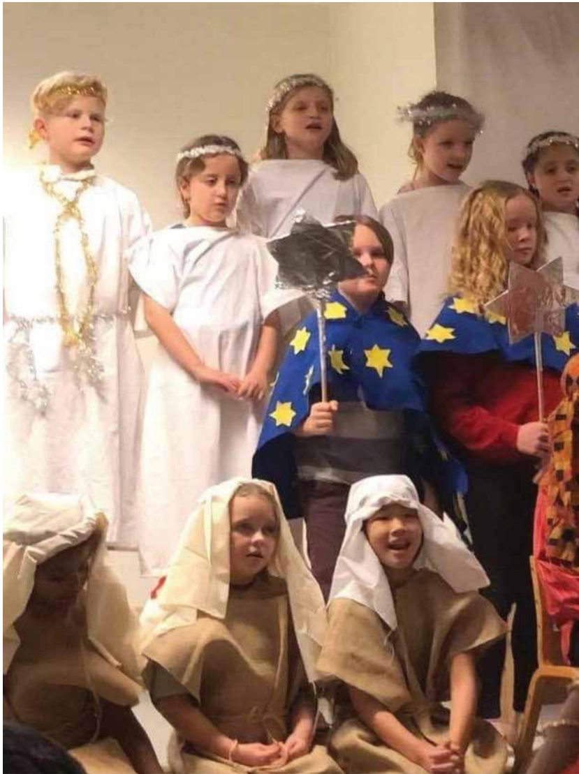
En scene fra julespillet.

Å formidle bibelhistorie for barn en hjertesak for Tordis Nilsen. Det har inspirert henne til å arrangere juleavslutninger med julespill i klassene sine på Hauglia skole i 24 år. Nå er hun pensjonist og håper noen viderefører tradisjonen.