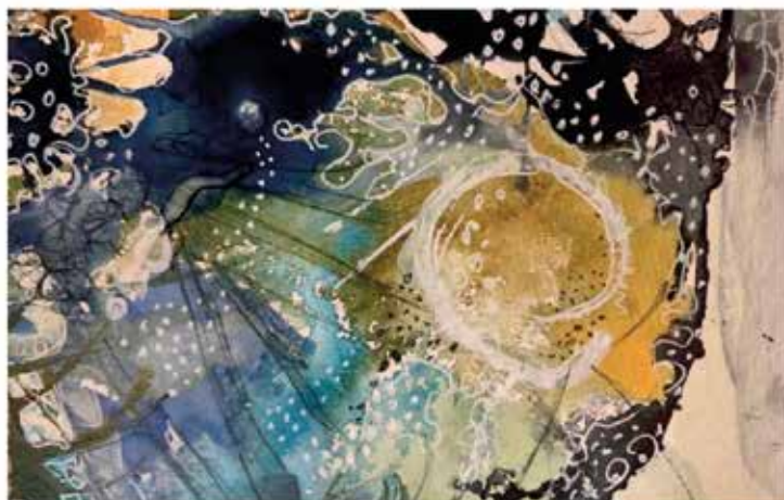
Eva Årre: Uten tittel