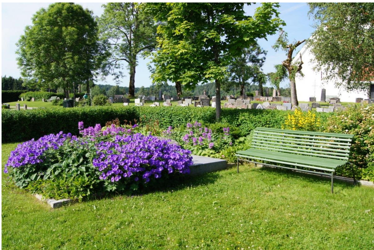
Minnelunden på Enebakk kirkegård.