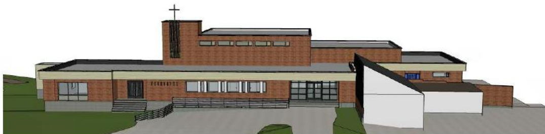
Bilder av Arkon arkitekt og ingeniørkontor

Ny utebelysning. Arbeidet ble igangsatt planmessig sommeren 2020. Omsøkt og godkjent av Tunsberg biskop. Belysningsarbeidet er på det nærmeste utført, men belysning av kirkens frontparti og kors gjennomføres samtidig som pågående takarbeider. Belysningsarbeidet har blitt adskillig mer omfattende enn forutsett. Store deler av det eksisterende ledningsnett kunne ikke benyttes grunnet avvik fra dagens regelverk, samt manglende dokumentasjon på det gamle anlegget. Dette har ført til betydelig merarbeid, men samtidig har kirken nå fått et el. anlegg som er forskriftsmessig oppdatert.