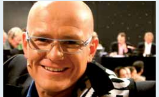
Jan Erik Larssen

Jan Erik Larssen, kjent fra "Autofil" og nå leder for programmet "Broom" på TV2, har sendt en varm og hjertelig gratulasjon til Søndagsskolen anledning jubileumet.