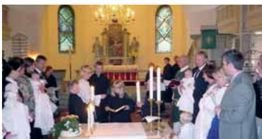
Som del av den nye liturgien settes et bord ned mot sentrum av kirken. Nattverden forrettes ved dette bordet. Liturgen kan i større grad forrette gudstjenesten fra sentrum av kirken.

Liturgiforslaget angir alternative ord som liturgene skal ledsage utdelingen av brød og vin med. I Nøtterøy kirke benyttet vi de utdelingsordene som var mest forskjellig fra hva vi er vant med. Og spørsmålet i responskjemaet var Liker du utdelingsordene "Kristi kropp, livets brød" og "Kristi blod, livets beger"? 45,2% svarte ja. 26,4% svarte nei. 21,6% svarte vet ikke.