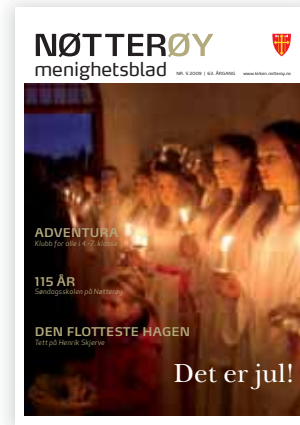
FORSIDEBILDE: Luciamorgen i Nøtterøy kirke

Torød kirke og kirkestue 33 38 43 30 Telefax 33 38 66 88 Kirketjener/vaktm. Ingrid Almquist 33 38 43 30