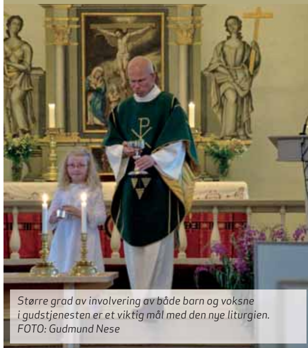
Større grad av involvering av både barn og voksne i gudstjenesten er et viktig mål med den nye liturgien.

"Store Gud, du som har skapt universet og alt liv på jorden. I ditt bilde skapte du oss, vi tilhører deg og er til for hverandre. Fyll oss med godhet, la oss bli til velsignelse. Amen".