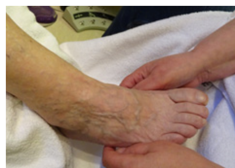
GOD PLEIE: Føttene får god pleie av Ellen Nilsen