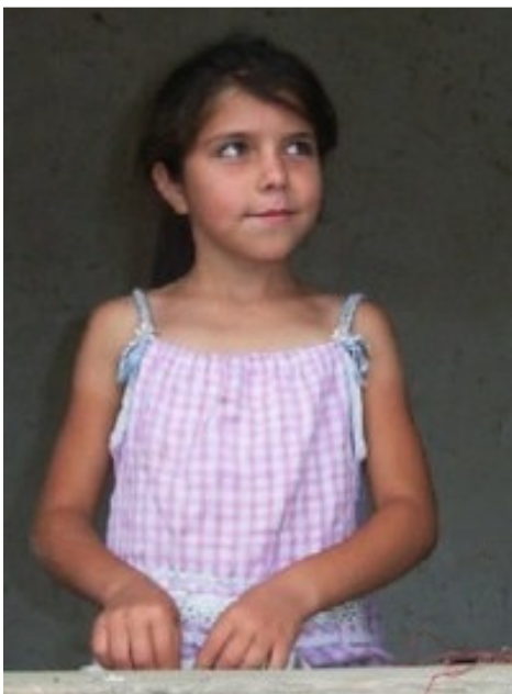
MISJONSPROSJEKTET BÆRER FRUKTER