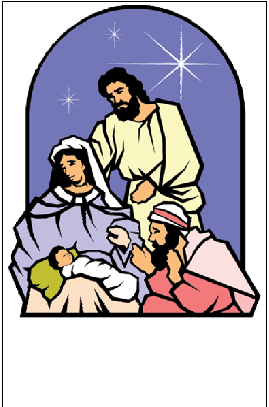
KRISTUS I BLANT OSS!